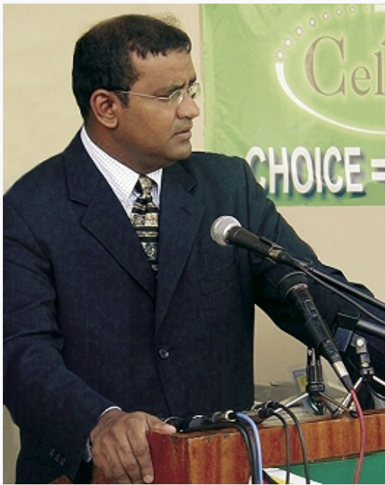
Выступление президента Гайаны Б. Джагдео. 2004.

конституции Бёрнхем стал также президентом страны). Однако ННК не удалось воплотить в жизнь ни один из своих лозунгов. Его курс вызывал всё большее недовольство как у индогайанцев, так и у радикальных групп афрогайанской общины. Лозунг и практика «кооперативного социализма» встречали оппозицию со стороны крупного бизнеса и ср. слоёв общества. С позиций правого национализма ННК критиковали мусульм. партия «Патриоты» и Движение за запрещение дискриминации, выступавшее как «многорасовый альянс интеллектуалов и рабочего класса».