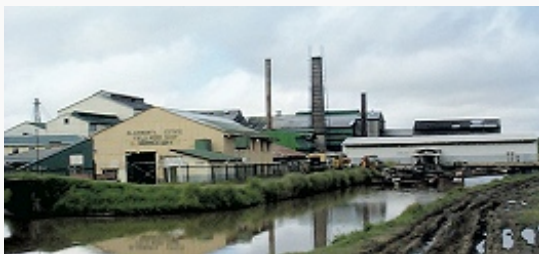
Сахарный завод государственной компании «Guysuco» близ Джорджтауна.

В пром-сти доминирующее положение занимает добыча бокситов (обеспечивает 15% ВВП), а также золота, алмазов, руд марганца.