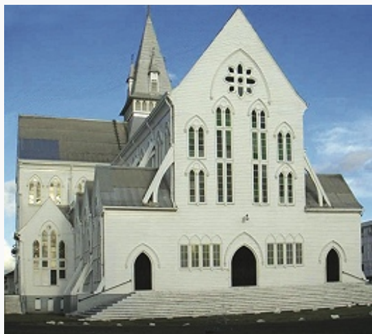
Собор в Джорджтауне. 1889-92. Архитектор А. Бломфильд.

Сохранились произведения местных мастеров, сочетающие негритянские и индейские традиции (резьба по дереву, гравиров. орнаменты и символич. изображения, узоры из вбитых в дерево медных гвоздей). Архит. сооружения в осн. одноэтажные, деревянные (бамбук, пальма, кебрачо), на высоких кирпичных опорах, разностильные (влияние исп., нидерл. и англ. зодчества); одна из крупнейших в мире дерев. церквей – псевдоготич. собор в Джорджтауне (1889–92,