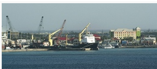
Собор в Джорджтауне. 1889–92.