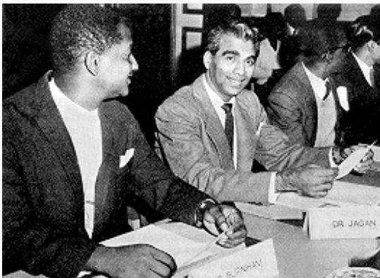
Премьер-министр Гайаны Л. Ф. С. Бёрнхем (слева) и лидер оппозиции Ч. Б. Джаган. Кон. 1960-х гг.

26.5.1966 под давлением массового движения за независимость Брит. Гвиана была провозглашена независимым государством и стала называться Гайаной; в том же году Г. принята в ООН. Однако в стране до дек. 1966 продолжало сохраняться введённое ещё брит. властями чрезвычайное положение, мн. видные деятели НПП были заключены в тюрьмы. В дек. 1968 в Г. состоялись первые после достижения независимости всеобщие выборы, на которых победу одержал ННК. США, стремившиеся