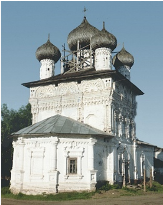
Никольская церковь в посёлке Нырб. 1704.