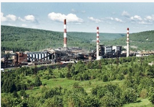
Вид предприятия «Губахинский

пром-сть 25,0, машиностроение 16,7, пищевая пром-сть и произ-во напитков 5,8, металлургия и произ-во готовых металлоизделий 5,7, деревообрабатывающая и целлюлозно-бумажная пром-сть, полиграфич. произ-во 5,2, произ-во стройматериалов 2,1, др. отрасли 3,6.