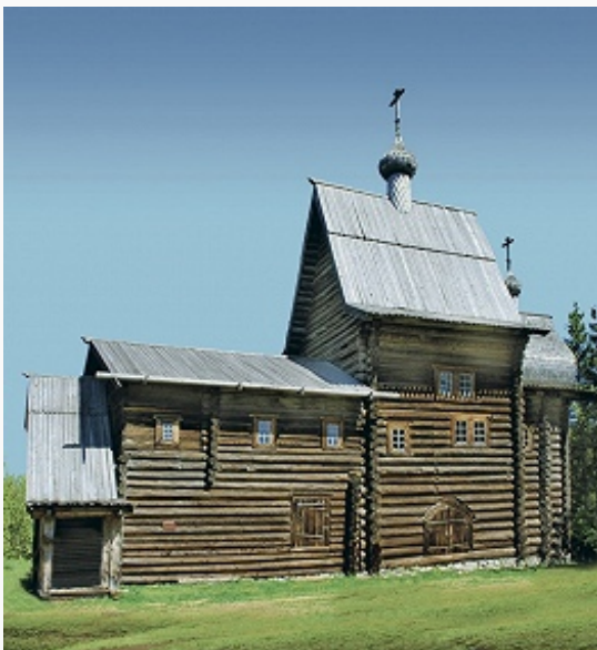
Церковь в честь иконы Божией Матери «Неопалимая Купина» из села Тохтарёво в архитектурно- этнографическом музее «Хохловка». 1694.

Спасо-Преображенский мужской (1636; все закрыты в 18 в.). Под влиянием моск. зодчества построены первые каменные храмы: ц. Св. Иоанна Богослова Иоанно-Богословского мон. в Чердыни (1623–24, не сохр.), одноглавая типа «кораблём» Крестовоздвиженская ц. в дер. Верх-Боровая – наиболее ранняя сохранившаяся в П. к. (1678; юж. придел и колокольня – 1683). Основываются новые монастыри: Спасо-Преображенский женский в Соликамске (1683; 5-главая Преображенская ц. с шатровой колокольней, 1683–92), Успенский Верх-Язьвинский мужской в с. Обвинск (1686; оба упразднены в 1764; восстановлен в 1997 как Свято-Успенский Обвинский; Успенский собор кон. 17 в.). В духе рус. узорчья 17 в. построены: 5-главые Троицкий собор (1684–97), Богоявленская ц. с шатровой колокольней (1687–95), ц. Спаса Нерукотворного (1689–91) в Соликамске, Никольская ц. в пос. Нырб (1704); одноглавые Троицкая ц. в быв. дер. Лёнва (ныне в черте г. Березники; 1687–88), 2-столпный Крестовоздвиженский собор в Соликамске (1698–1709). Композицию 5-главых строгановских храмов продолжают Спасо-Преображенский собор в Усолье (1724–31) и Богоявленская ц. в Чердыни (1751–61). Под влиянием нарышкинского барокко построена редкая для П. к. церковь типа «восьмерик на