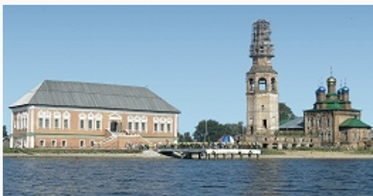
Палаты Строгановых (1724) и Спасо-Преображенский собор (1724–31) в Усолье.

В П. к. были сильны древние традиции церковного дерев. зодчества. В 17–18 вв. превалировали храмы клетского типа, но строились также церкви центрич. типа (в т. ч. Богоявленская в с. Пянтег, типа «шестерик от земли», 1617) и с кубоватым завершением (ц. Святых Зосимы и Савватия Соловецких в с. Торговище, 1701; сохранилась 6-гранная колокольня, 1715). С кон. 18 в. часто