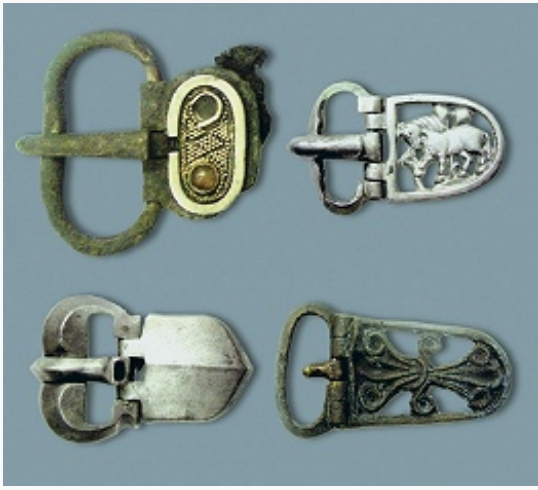
Пряжки 6–8 вв. из Верх-Саинского могильника неволинской культуры (Берёзовский район). Удмуртский государственный университет (Ижевск).

Начало эпохи раннего металла (кон. 4-го – сер. 3-го тыс. до н. э.) в регионе связано с новоильинской и борской культурами. Генезис новоильинской культуры (распространена по всему Прикамью) не вполне ясен, но наблюдается преемственность с памятниками поздней стадии камского неолита типа Чернашка. Показательны открытые полуяйцевидные сосуды с гребенчатой орнаментацией, образующей узоры в виде горизонтальных рядов, зигзагов и флажков, часто встречаются узоры из кружкового и ямочного орнамента. Есть находки накольчатой нижнекамской посуды тат-азизбейского типа и