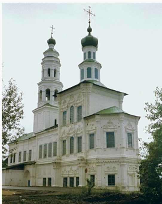
Церковь Рождества Иоанна Предтечи в Соликамске. 1721–72.

Наиболее древние памятники иск-ва на территории П. к. – наскальные изображения (в т. ч. по берегам р. Вишера), произведения пермского звериного стиля . Ранние памятники оборонит. архитектуры – валы Искорского городища (12–14 вв.), остатки Анфаловского городка (нач. 15 в.), Чердынского (1535) и Кунгурского (1675) дерев. кремлей. С сер. 16 в. построены (в т. ч. на средства Строгановых ) укрепленные пункты Канкор (близ с. Пыскор), Кергедан (Орёл-городок), Нижние и Верхние Чусовские городки, острожки Сылвенский и др.