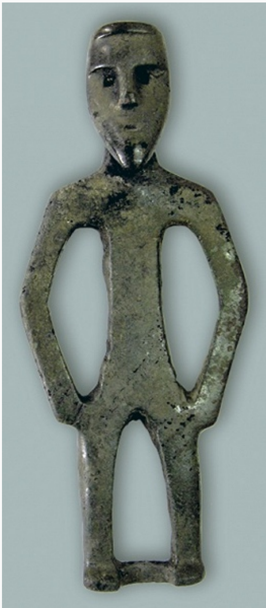
Медный идол из могильника сейминско-турбинской культуры Бор-Лёнва (Добрянский район). Пермский краеведческий музей.

местных традиций и с чертами, характерными для конца палеолита Русской равнины. Они характеризуют культуру охотников на северного оленя и дикую лошадь; среди орудий – резцы для обработки кости, усечённые пластины, наконечники стрел, показательные для свидерской культуры и аренбургской культуры, вкладыши-трапеции. Для «классического» мезолита характерно распространение микролитов-вкладышей; появляются сланцевые топоры с частичной шлифовкой, лук и стрелы, развивается охота на северного оленя, лося, медведя. На заключительной фазе мезолита активнее развивается промысел водоплавающей птицы и рыболовство; уровень микролитизации инвентаря уменьшается, появляются более крупные пластины и орудия на них, разнообразные шлифованные топоры, тёсла.