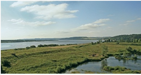
Долина р. Кама.