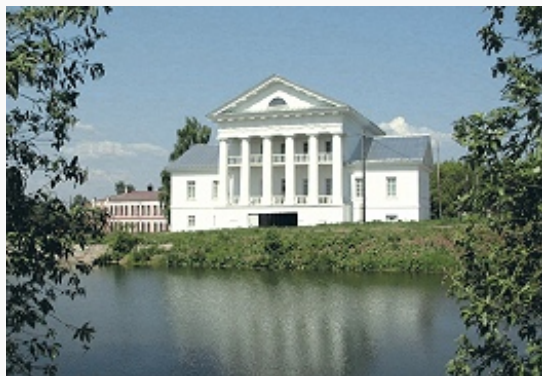
Здание Главного правления пермскими именьями Строгановых в посёлке Ильинский. 1805.