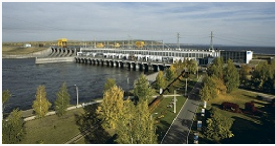
Воткинская ГЭС. ОАО «РусГидро»

15,2, сельское и лесное хозяйство 8,2, транспорт и связь 7,9, операции с недвижимым имуществом, аренда и услуги 7,8, строительство 7,4, образование 7,2, здравоохранение и социальные услуги 6,3, пр. коммунальные, социальные и персональные услуги 3,4, произ-во и распределение электроэнергии, газа и воды 2,5, гостиничный и ресторанный бизнес 2,3,