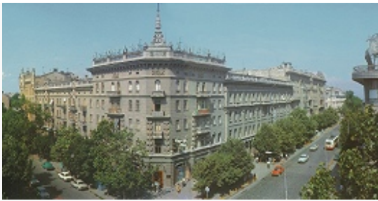
Дом китобойной флотилии «Слава». 1953. Архитекторы Г. В. Топуз, В. Л. Фельдштейн.

Р. Шидловского (1829–30, арх. Боффо; с 1924 Дворец культуры моряков), Старая биржа (1829–34, архитекторы Боффо и Г. И. Торичелли; перестройка – 1871–1873, арх. Ф. О. Моранди; ныне здание мэрии), жилые дома 1823–36. В центре бульвара – полукруглая площадь с двумя образующими её зданиями (Присутственные места, 1826–30, и гостиница «Петербургская», 1833, оба – арх. А. И.