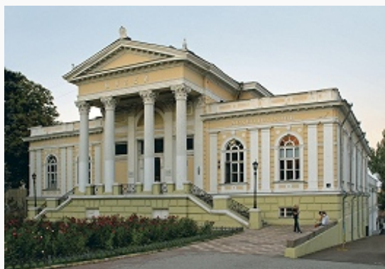
Здание Археологического музея. 1882–83. Архитектор Ф. В. Гонсиоровский.

◀ Одесская филармония. 1894–99. Архитектор А. И. Бернардацци. Здание ▶ Национальной научной библиотеки им. М. Горького. 1904–06. Архитектор Ф. П. Нестурх.