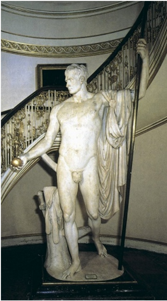
А. Канова. «Наполеон I в виде Марса-Миротворца». Мрамор. 1803–06. Собрание герцога Веллингтона, Эпли-хаус (Лондон).

др.). О. н. сохраняется в мифологич. скульптуре (Дж. Л. Бернини ) и живописи: у П. П. Рубенса она представлена с органической витальностью, у Рембрандта («Вирсавия», 1654, Лувр; «Даная», 1636–47, Эрмитаж, С.-Петербург) – в интимной и лирич. трактовке, Д. Веласкес напрямую обращается к венецианской традиции («Венера перед зеркалом», до 1651, Нац. галерея, Лондон), Караваджо использует О. н. в аллегорич. сюжетах («Амур-победитель», ок. 1603, КГ, Берлин). Во франц. классицизме 17 в. (Н. Пуссен , П. Пюже ) О. н. предстаёт идеализированной и антикизированной. Франц. рококо вернуло О. н. чувственность и эротизм («Светловолосая одалиска» Ф. Буше , 1752, Старая пинакотека, Мюнхен; статуэтки Э. М. Фальконе и др.). Идеалистически-антикизированный и героизированный подход к О. н. возрождается в иск-ве классицизма 2-й