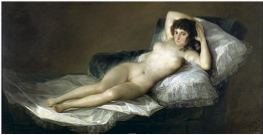
Ф. Гойя. «Маха обнажённая». 1798–1805. Прадо (Мадрид).

зап.-европ. символизма и модерна (Г. Моро , П. Пюви де Шаванн , А. Бёклин , М. Клингер , Ф. Ходлер , Х. Макарт , Ф. фон Штук , П. Гоген и др. в живописи, О. Роден , Г. Вигеланн и др. в скульптуре).