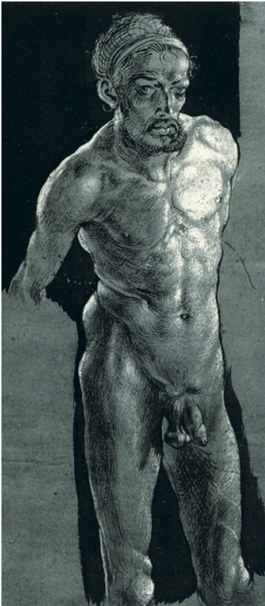
А. Дюрер. «Автопортрет в обнажённом виде». Кисть, перо, чернила, белила. Ок. 1505. Художественные собрания Веймара.

анатомич. трактовке, широко использует О. н. в своих гравюрах («Адам и Ева», 1504; «Геракл на распутье», 1498). В то же время у Дюрера контакт с натурой становится более непосредственным, что приводит к появлению неидеализированных образов (гравюры «Мужская баня», ок. 1497, и «Женская баня», 1496; рисунок «Автопортрет в обнажённом виде», ок. 1505, Худож. собрания Веймара).