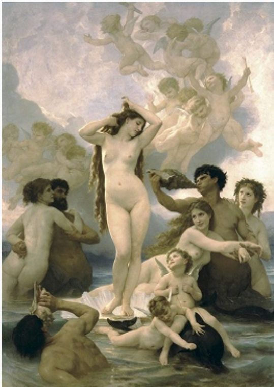
А. В. Бугро. «Рождение Венеры». 1879. Музей Орсе (Париж).

зап.-европ. символизма и модерна (Г. Моро , П. Пюви де Шаванн , А. Бёклин , М. Клингер , Ф. Ходлер , Х. Макарт , Ф. фон Штук , П. Гоген и др. в живописи, О. Роден , Г. Вигеланн и др. в скульптуре).