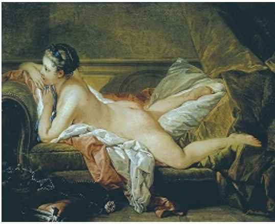
◀ Ф. Буше. «Светловолосая одалиска». 1752. Старая пинакотека (Мюнхен).

Мюллер , Э. Л. Кирхнер , Э. Хеккель , К. Шмидт-Ротлуф , М. Пехштейн и др.) деформаций. С др. стороны, О. н. начинает восприниматься как отвлечённый живописный жанр, подобно натюрморту или пейзажу, со своим особым набором живописных свойств и возможностей. Эти возможности активно исследуются П. Сезанном , А. Модильяни и др. Попытки реконструкции отношения архаических культур к этой теме представлены работами скульпторов европ. неоклассицизма (А. Майоль ,