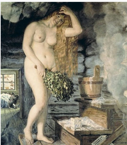
Б. М. Кустодиев. «Русская Венера». 1925–26. Художественный музей (Нижний

Ш. Деспю , Э. А. Бурдель ), также М. Марини , Э. Греко , А. Джакометти , Дж. Манцу , В. Аалтонена и др. В 1930-е гг. к изображению О. н. обращался модернизированный неоклассицизм, ставший офиц. стилем Третьего Рейха искусства в Германии (А. Брекер и др.), фашистского искусства в муссолиниевской Италии (скульптуры «Форо Италико» в Риме) и в сталинском СССР. В середине – 2-й пол. 20 в. тема О. н. используется художниками, исследующими человеческую сексуальность, загадочные процессы подсознания (Д. Хокни , Ф. Бэкон , Л. Фрейд и др.).