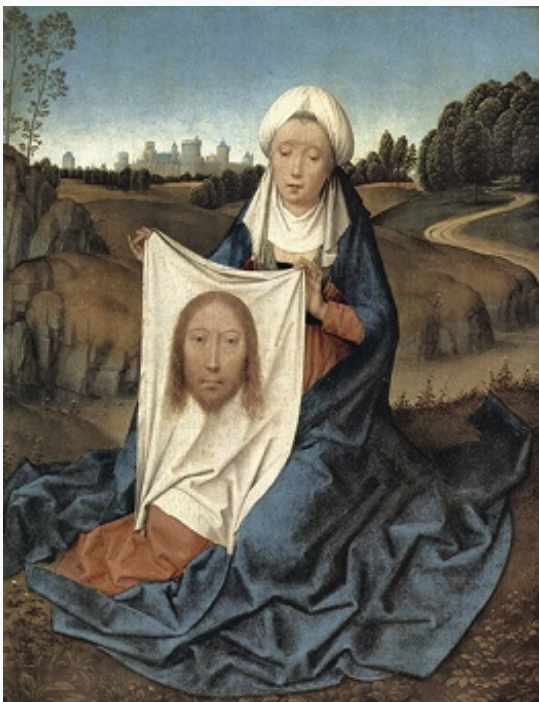
«Святая Вероника». Художник Х. Мемлинг. 1470–75. Национальная галерея искусства

Сцены с историей Н. о., начиная с синайской иконы 10 в., получили распространение в миниатюрах рукописей, на иконах и окладах, в монументальных росписях [миниатюры минология 11 в., Нац. б-ка, Париж, Gr. 1528. Fol. 181v; миниатюра Хроники Иоанна Скилицы (перенесение Н. о. в Константинополь), 12 в., Нац. б-ка, Мадрид, Gr. 2. Fol. 131r; миниатюры лат. рукописи 13 в., Нац. б-ка, Париж, Lat. 2688; клейма серебряного визант. оклада иконы из Генуи; цикл истории Н. о. в росписи собора Рождества Богородицы мон. Матейч, Македония, 1356–60]. В кон. 16–17 вв. в рус. иск-ве получили распространение иконы Спаса Нерукотворного с иллюстрациями «Сказания о Спасе Нерукотворном» в клеймах (напр., икона Кирилла Уланова в ц. Покрова в Филях в Москве, 1694).