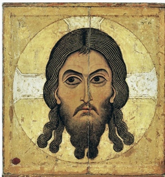
«Спас Нерукотворный». Икона. 2-я пол. 12 в. Новгород. Третьяковская галерея (Москва).

Помимо Эдесского Мандилиона известен Н. о. из Камулианы (Малая Азия; 6 в.) – найденный в колодце отпечаток лика Христа на ткани, от соприкосновения с которым чудесно возник второй Н. о. также на ткани. Ещё один отпечаток на черепице почитался в г. Иераполис (Малая Азия), где по дороге из Иерусалима останавливался посланник царя Авгаря Анания, спрятавший во время ночлега св. Мандилион среди кирпичей.