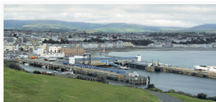
Мэн. Вид города Дуглас.

Первые следы пребывания человека на о. М. относятся к мезолиту (8–7-е тыс. до н. э.), в сер. 1-го тыс. до н. э. М. был заселён кельт. племенами (вероятно, бриттами ). М. был известен др.-рим. географам (под назв. Мевания или Менавия; Mevania , Maenavia ), но не входил в рим. пров. Британия. В первые века н. э. началась миграция на М. ээлов (из Ирландии и Сев. Британии), которые к 6 в., вероятно, стали составлять большинство населения. Достоверных данных о политич. статусе М. в кельт. эпоху нет; вероятнее всего, он был самостоят. королевством (кроме краткого периода в 1-й пол. 7 в., когда входил в состав англосаксонского королевства Нортумбрия). В нач. 6 в. население М. приняло христианство (благодаря деятельности ирл. миссионеров). С кон. 8 в. М. подвергался набегам викингов , которые со 2-й пол. 9 в. стали селиться на острове. В 10–11 вв.