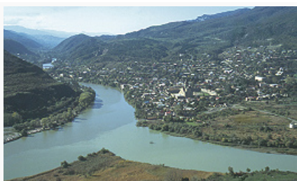
Мцхета. Вид города от монастыря Джвари.

По легенде, М. основана во 2-й пол. 1-го тыс. до н. э. сыном первого груз. царя Мцхетосом. По археологич. данным, как город М. формировался с 4 в. до н. э. С 3 в. до н. э. – столица вост.-груз. гос-ва Картли (см. Иберия ). В 65 до н. э. временно захвачена рим. полководцем Гнеем Помпеем . Несмотря на перенос столицы в 6 в. в Тифлис (ныне Тбилиси) и разрушения в 730-е гг. в ходе арабских завоеваний , М. до 19 в. оставалась местом коронации и захоронения груз. царей, а также резиденцией главы Грузинской православной церкви – католикоса-патриарха. После восстановления автокефалии Груз. православной церкви (1917) М. вновь стала резиденцией её предстоятелей. С 15 в. значит. городской и торговоремесленный центр Картлийского государства , с 1762 – Картли-Кახетинского царства. С 1801 в составе Рос. империи, с 1921 – Груз. ССР, с 1991 – Грузии.