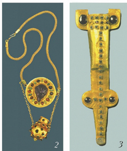
Находки из Армази: 1 – чаша. 3 в.; 2, 3 – ожерелье и ножны кинжала из некрополя питахшей 2–3 вв. Золото, аметист, гранаты, бирюза, стекло. Государственный музей Грузии имени С. Джан...

Близ М. (входит в Большую Мцхету), на горе Багинети и по берегам ущелья Армазисхеви находится историч. ядро М. – Армази (известна также как Гармозика у Страбона , Гармаст у Плиния Старшего , Армактика у Птолема ). Исследованы сооружения царского дворца, в т. ч. баня 2–3 вв.; склеп, каменный саркофаг. Из остатков резиденции питахшей (высших сановников) первых веков н. э. изучались колонный зал, баня, склеп «у ж.-д. станции» (кон. 1 – нач. 2 вв.), некрополь питахшей 2–3 вв.; среди находок: золотые, в т. ч. со вставками, украшения, обкладки ножен; серебряные сосуды, обкладки ножек погребального ложа; геммы; стела с эпитафией Серафиты на греч. и арамейском языках («Армазская билингва») и др. Найдены также следы керамич. и стеклодувного произ-ва 11–13 вв.; греч. надпись о строительстве оборонительных стен в 75 н. э. Вблизи Армазисхеви находятся руины мон. Св. Нины (5–6 вв., 3-я четв. 12 в., восстановлен в 19 в.), Армазского мон. Св. Богородицы (12 в.), «Ольгинский» (Ахалкалакури) мон. (12 в., восстановлен в кон. 19 в.).