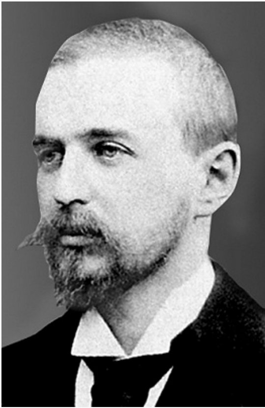
Граф В. В. Мусин-Пушкин (1870–1923). Фото нач. 20 в.

Королевство сербов, хорватов и словенцев.