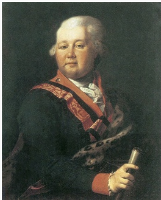
Граф В. П. Мусин-Пушкин. Портрет работы Д. Г. Левицкого. Кон. 1780-х – 1790-е гг. Павловский дворец-музей.

латинское (для подготовки в университеты) и юридическое (для поступления на воен. или гражд. службу) отделения; в 1855 добился перевода в С.-Петербур. ун-т кафедр Вост. разряда историко-филос. ф-та Казанского ун-та.