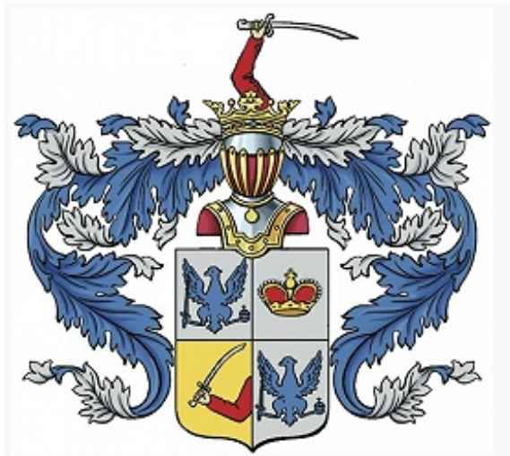
Герб дворянского рода Мусиных-Пушкиных.