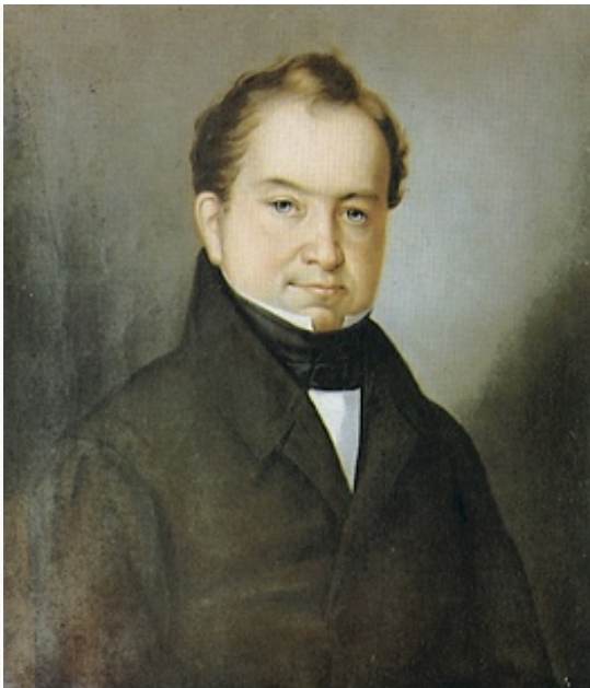
Граф И. А. Мусин-Пушкин. Портрет работы неизвестного художника. 1820-е гг. Рыбинский государственный историко-архитектурный и художественный музей-заповедник.