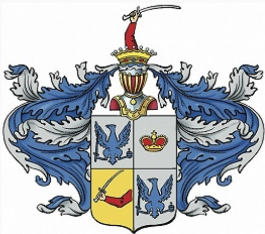
Герб графского рода Мусиных-Пушкиных.

жена [с 28.3(9.4).1811] кн. Д. М. Волконского (1769 или 1770–1835; из рода Волконских ); Александр Алексеевич (1788–4.4.1813), поэт, переводчик, историк (б. ч. сочинений не сохр.), продолжатель археографич. деятельности отца, в 1809–10 состоял при главнокомандующих рос. Дунайской (Молдавской) армией ген.-фельдм. кн. А. А. Прозоровском и ген. от инф. кн. П. И. Багратионе, участник Отеч. войны 1812 и заграничных походов рос. армии 1813–1814, врем. команд. гарнизоном Берлина (1813), смертельно ранен при взятии Люнебурга 21.3(2.4).1813; Софья Алексеевна [2(13).3.1792–28.9(10.10).1878], жена [с 28.1(9.2).1820] кн. И. Л. Шаховского (1777–1860; из рода Шаховских ); Варвара Алексеевна [17(28).7.1796–13(25).2.1829], 1-я жена кн. Н. И. Трубецкого [31.3(11.4).1797–25.5(6.6).1874; см. в ст. Трубецкие ]; Владимир Алексеевич [31.3(11.4).1798–17(29).8.1854], л.-гв. капитан (1824), в 1817–25 служил в л.-гв. Измайловском полку, адъютант главнокоманд. 1-й армией гр. Ф. В. Остен-Сакена, декабрист, чл. Северного об-ва (1825). Арестован в Могилёве 2(14).1.1826. По Высочайшему повелению [15(27).6.1826] после месяца заключения в