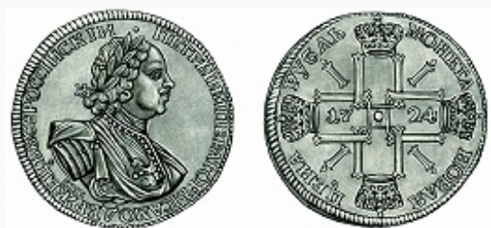
Рисунок Р. И. Маланичева