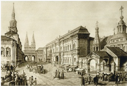
Новый Красный (Китайский) монетный двор в Москве. Раскрашенная гравюра. 1802.

МОНЕТНЫЙ ДВОР, предприятие, занимающееся чеканкой монет (в т. ч. памятных из драгоценных металлов), изготовлением орденов, медалей и др. металлич. знаков отличия. Первые М. д. возникли в период античности в странах Средиземноморья. В 9–10 вв. в связи с массовой чеканкой денариев в странах Зап. Европы М. д. появились в значит. количестве, однако штат большинства М. д. не превышал 5–12 работников. В 13–14 вв. число М. д. за счёт закрытия мелких М. д. значительно сократилось, производство монеты сосредоточилось, как правило, в крупных городах или вблизи серебряных и медных рудников. В кон. 19 – нач. 20 вв. чеканка монеты большинства европ. государств стала осуществляться на крупнейших М. д. Ныне действуют М. д. в городах Кремница (Словакия; с 1328), Вашингтон (США; с 1792), Бирмингем (Великобритания; с 1794), Берн (Швейцария; с 1906) и др.