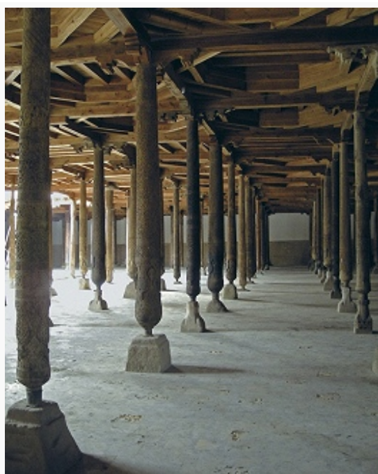
Джума-мечеть в Хиве (Узбекистан). Внутренний двор. Кон. 18 в.

биографа Мухаммеда, собственно М. служил примыкавший к дому с запада просторный двор, окружённый 7-метровой сырцово-глиняной стеной на каменном фундаменте, с 3 входами; на северной (в направлении к Иерусалиму), а затем и на южной, обращённой к Мекке стороне были созданы зоны тени – навесы из скреплённых глиной пальмовых листьев, положенных на стволы пальм. Композиция Мечети Пророка, сложившаяся к сер. 7 в., стала отправной точкой в развитии соборной М. колонного, или арабского, типа. По её образцу устраивались походные М. араб. отрядов: начертанный на земле квадрат с копьём, воткнутым на стороне киблы.