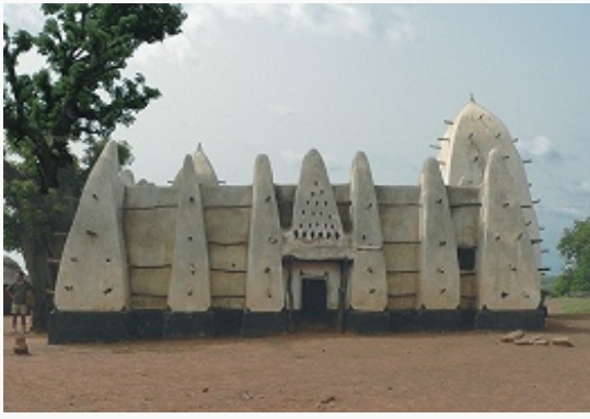
Мечеть в деревне Ларабанга (Западная Гана). 17 в.

раньше и ярче проявились достижения собственно исламского зодчества, свидетельствующие об умелом использовании чужого опыта, изобретательности и мастерстве их создателей, об их успехах в области инженерного и оформительского иск-ва, о разнообразии технич. приёмов и худож. стилей при сохранении общих, единых, всегда узнаваемых черт мусульм. молитвенного