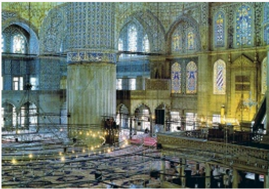
Мечеть Ахмеда I (Ахмедие, или Голубая мечеть) в Стамбуле. Интерьер. 1609–17. Архитектор Мехмет-ага.

В формировании М. колонного типа важная роль принадлежит Омейядов мечети в Дамаске, М. Аль-Акса в Иерусалиме и Мечети Пророка в Медине (707–709), в которой впервые появились такие отличительные элементы соборной М., как михраб, минбар, купол и минарет. Гос. значение всех трёх религ. центров первой мусульм. державы подчёркивал парадный декор: узорные облицовки мраморными плитами, золочёные резные капители, орнаментальные росписи, рельефы и оконные решётки, смальтовая мозаика с