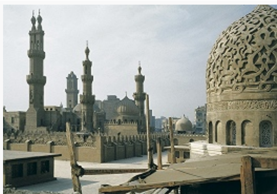
Мечеть аль-Азхар в Каире. 970–972 (перестраивалась).

Архит. типы М. складывались параллельно с формированием мусульм. образа жизни, в котором важнейшее значение приобрела еженедельная совместная молитва верующих и проповедь главы общины в «день сбора» – пятницу. Здание для коллективной молитвы получило название соборной (джамии) или пятничной (джума) М. В первые века ислама соборная М. нередко исполняла также функции духовной школы, богословского центра, приюта