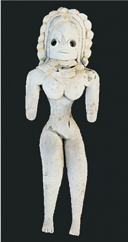
Мехргарх. Терракотовая статуэтка. Период VII. Департамент археологии и музеев (Карачи, Пакистан).

Неолитич. слои М. и памятники в долине Ганга ( Лекхакхия, Махагара и др.) рассматривают как свидетельство полицентризма Неолитической революции . Энеолитич. материалы М. важны для синхронизации культур долин Белуджистана и др. регионов, до юга Ср. Азии и территории Ирана, исследования самобытных культур, позднее включённых в хараппскую цивилизацию.