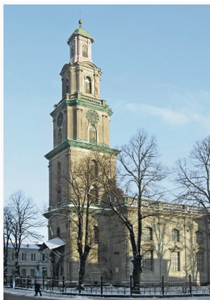
Лиепая. Церковь Святой Троицы. 1742–58. Архитектор И. Х. Дорн.

Впервые упоминается в 1253 как рыбацкий посёлок Лива (Līva) во владениях Ливонского ордена. В 1560 после его распада под назв. Либава передан в залог Пруссии. С 1609 в составе Курляндского герцогства , городское право с 1625. В 1697 началось строительство порта. С 1795 в составе Рос. империи, уездный город Курляндской губернии . Один из 5 крупнейших портов страны в нач. 20 в. В 1915 в ходе 1-й мировой войны оккупирован герм. армией. В 1917 переименован в Л. В 1919 место пребывания латв. врем. правительства, до 1940 один из осн. экономич. центров Латв. республики. В 1940 Л. присоединена к СССР, в 1941 оккупирована герм. армией, освобождена 9.5.1945. В 1945–91 в составе Латв. ССР. В 1967 Л. приобрела статус «закрытого города», одна из гл. баз сов. Балт. флота. С 1991 в Латв. Республике.