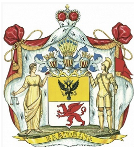
Герб рода светлейших князей Лопухиных.