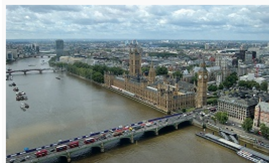
Панорама Лондона. В центре – здание Парламента.

ЛОНДОН (London), столица Великобритании, адм. центр Англии; имеет статус метрополитенского графства (включает 32 округа и окр. Сити с особым статусом). Второй по численности населения город Европы (после Москвы) и крупнейший в странах ЕС. Нас. 7,74 млн. чел. (2010; св. 40% – иммигранты, в т. ч. ок. 11% – европейцы). Образует ядро конурбации Большого Лондона с нас. более 8,3 млн. чел. и т. н. Метрополитенского р-на с нас. до 14 млн. чел. (включает «метрополитенский пояс», практически совпадающий с поясом трудовых поездок населения, насчитывает до сотни городов). Расположен на юго-востоке Англии, в низовьях р. Темза. Гл. транспортный узел страны (структура брит. транспортной сети имеет радиальный характер с центром в Л.). Ж.-д. и автомобильное сообщение со странами Европы через Евротоннель (1994). Крупнейший брит.