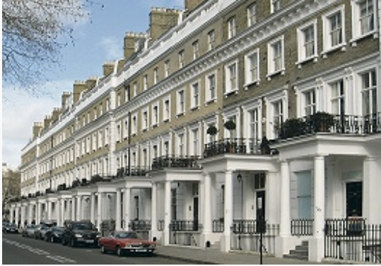
Жилая застройка района Кенсингтон 19 в.

[Королевская академия искусств в классицистич. здании Берлингтон-хаус (17–19 вв., архитекторы Дж. Гиббс, К. Кэмпбелл и др.), Британская галерея Тейт , Ин-т совр. иск-ва (в комплексе Карлтон-хаус-террас; 1827–29, Нэш), Лейтон-хаус (1870-е гг., арх. Дж. Эйтчисон), Уоллес собрание и др.].