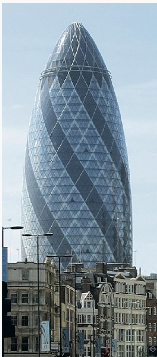
Здание компании «Swiss Re» (ныне «30 Сент Мэри Акс»). 1997–2004.

пол. 17 в.; б. ч. зданий относится к периоду после «Великого пожара» 1666.