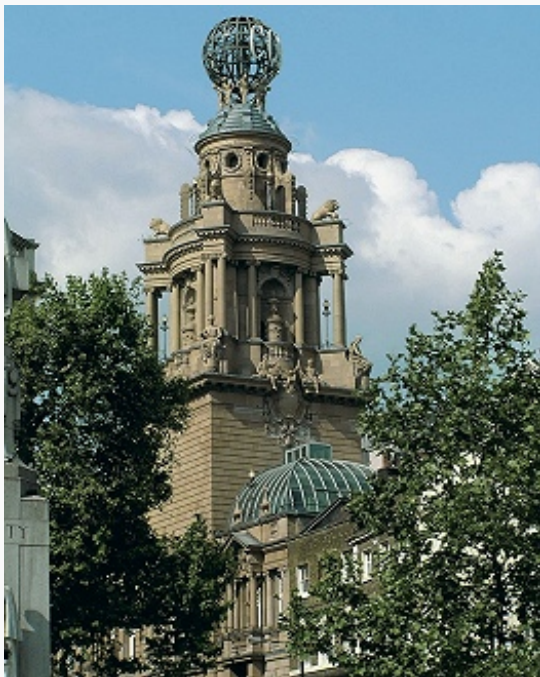
«Колизей». 1904. Архитектор Ф. Матчем.

оркестр , др. оркестры: Оркестр Би-Би-Си (1930), Королевский филармонический (1946), Английский камерный (1948; совр. назв. с 1960); «Революционный и романтический оркестр» (1989; в основе репертуара – музыка венских классиков и композиторов эпохи романтизма), «Лондонская симфониетта» (1968; специализируется на музыке 20–21 вв.).