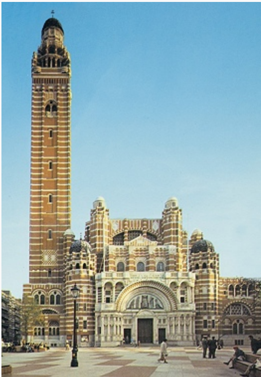
Вестминстерский собор. 1895–1903. Архитектор Дж. Бентли.

британцах (1919–20, арх. Э. Лаченс ). Ул. Уайтхолл завершает классицистич. пл. Трафальгар-сквер (1820–40-е гг.) с колонной Нельсона (1839–43; выс. 56 м), ц. Сент-Мартин-ин-те-Филдс (1720–26, арх. Дж. Гиббс ) и Национальной галереей .