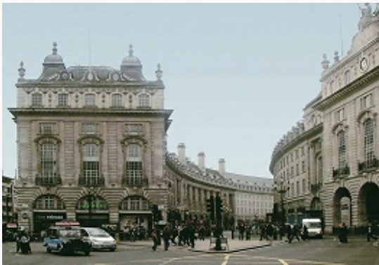
Улица Риджент-стрит с застройкой 19 в.

Севернее Трафальгар-сквер, частично в границах совр. Вестминстера, находится историч. р-н Вест-Энд, который сложился в 17–19 вв. как место расположения особняков аристократии, модных магазинов, лучших развлекат. учреждений (до сих пор славится своими театрами, ресторанами, магазинами, гостиницами), а также как деловой центр. В Вест-Энде – ансамбль пл. Ковент-Гарден с ц. Св. Павла (1630–31; арх. И. Джонс, перестроена в 1795) и театром «Ковент-Гарден» ; торговые улицы Оксфорд-стрит (у её начала, близ границы Гайд-парка, – «Мраморная арка», 1828, арх. Дж. Нэш ), Бонд-стрит, Риджент-стрит с застройкой 19 в. (планировка – Нэш), жилые кварталы Адельфи (1768–72) и Портленд-плейс (с 1776; оба – арх. Р. Адам), районы Пиккадилли, Сохо, Чайнатаун и др. Также в границах совр. Вестминстера расположены королевский дворец Сент-Джеймс в тюдоровском стиле (16–19 вв.), классицистич. Сомерсет-хаус (1776–86, арх. У. Чеймберс ; ныне Курто институт ), неоготич. комплекс Королевского суда (1874–82, арх.