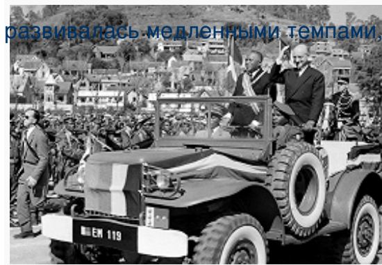
Ф. Циранана (слева) во время церемонии провозглашения независимости Малагасийской Республики. Фото. 26. 6.1960.

развивалась медленными темпами, гл. обр. за счёт привлечения иностр. капитала. 18.5.1972 в условиях глубокого экономич. и социально-политич. кризиса президент был вынужден объявить о роспуске правительства и передать власть ген. Г. Рамананцуа. Правительство Г. Рамананцуа пересмотрело неравноправные франко-малагасийские соглашения 1960 и подписало в июне 1973 новые договоры, по которым на М. были ликвидированы франц. воен. базы, с территории острова выведены франц. войска. Рамананцуа ограничил деятельность иностр. капитала, инициировал выход М. из «зоны франка». Политика Рамананцуа вызвала недовольство кругов, ориентированных на сотрудничество с Францией, и иностр. компаний. В февр. 1975 после подавления воен. мятежа власть в стране перешла к Нац. к-ту воен. директории. 15.6.1975 директория избрала новым главой гос-ва Д. Рацираку .