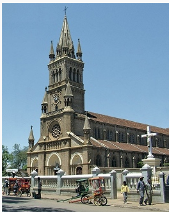
Собор Богоматери в Анцирабе.