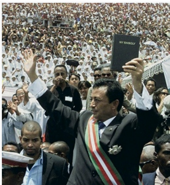
М. Равалуманана выступает на митинге своих сторонников. Фото. Декабрь 2001.

Резкое ухудшение экономич. положения страны, в т. ч. вследствие падения цен на экспортные культуры, обусловило в 1986 отказ правительства М. от провозглашённого в Хартии курса социально-экономич. развития. В окт. 1991 под давлением оппозиции Д. Рацирака был фактически отстранён от власти. В 1992 принята новая конституция (страна стала называться Республика Мадагаскар), закрепившая парламентскую форму правления. На президентских выборах 25.11.1992 победу одержал А. Зафи. Следуя рекомендациям МВФ и МБРР, Зафи предпринял ряд шагов по либерализации экономики, которые, однако, не привели к стабилизации внутривнутриполитич. ситуации. В конце июля 1996 Зафи был отстранён от должности в результате импичмента. Президентские выборы 29.12.1996 принесли победу Рацираке. В 1998 в конституцию М. были внесены изменения, президентские полномочия расширены, провинции М. получили автономию.