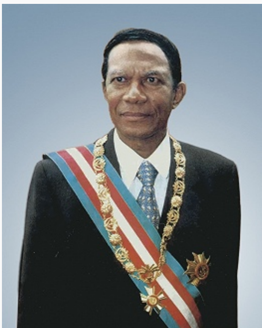
Д. Рацирака. Фото. 1970-е гг.

развивалась медленными темпами, гл. обр. за счёт привлечения иностр. капитала. 18.5.1972 в условиях глубокого экономич. и социально-политич. кризиса президент был вынужден объявить о роспуске правительства и передать власть ген. Г. Рамананцуа. Правительство Г. Рамананцуа пересмотрело неравноправные франко-малагасийские соглашения 1960 и подписало в июне 1973 новые договоры, по которым на М. были ликвидированы франц. воен. базы, с территории острова выведены франц. войска. Рамананцуа ограничил деятельность иностр. капитала, инициировал выход М. из «зоны франка». Политика Рамананцуа вызвала недовольство кругов, ориентированных на сотрудничество с Францией, и иностр. компаний. В февр. 1975 после подавления воен. мятежа власть в стране перешла к Нац. к-ту воен. директории. 15.6.1975 директория избрала новым главой гос-ва Д. Рацираку .