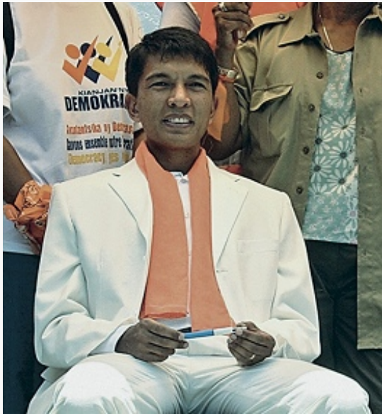
А. Радзуэлина. Фото. Декабрь 2008.

В результате переворота 17.3.2009 к власти пришёл быв. мэр Антананариву и лидер оппозиции А. Радзуэлина. Он выступил с обещанием стабилизировать внутривнутриполитич. ситуацию в стране и обеспечить проведение демократич. выборов. 8.8.2009 Радзуэлина и быв. президенты М. – М. Равалуманана, Д. Рацирака и А. Зафи – подписали политич. соглашение о принципах преодоления внутривнутриполитич. кризиса в республике. В дек. 2010 принята новая Конституция М.