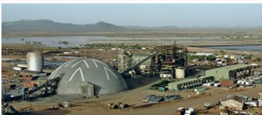
Фабрика по обогащению медных руд месторождения Гельб- Могрейн компании «First Quantum Minerals Ltd.».

были заключены двусторонние соглашения о торговле (1966), культурном и науч. сотрудничестве (1967), возд. сообщении (1974), сотрудничестве в области мор. рыболовства (1978) и др. Осн. направлениями сотрудничества между М. и РФ являются нефтедобыча, железорудное произ-во, рыболовство, мор. хозяйство.