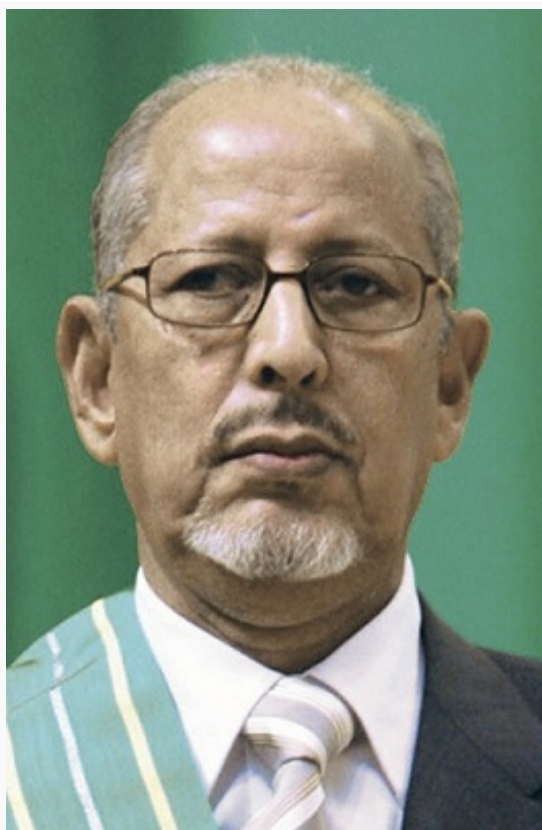
Сиди Мохамед ульд Шейх Абделлахи.

В результате воен. переворота 3.8.2005 Тайя был свергнут. Управление страной перешло к Воен. совету за справедливость и демократию (ВССД), который распустил парламент, приостановил действие Конституции 1991 и сформировал переходное гражд. правительство. В 2006 правительство освободило из тюрем мавританских исламистов, обвинявшихся при Тайя в связях с экстремистскими организациями, в т. ч. Аль-Каидой , а затем объявило всеобщую амнистию заключённым.