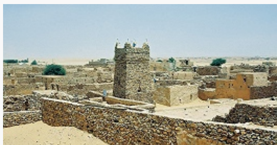
Шингетти. Старый город.

К неолиту и более поздним периодам относятся мегалиты (кромлехи, менгиры) и многочисл. наскальные росписи и петроглифы с изображениями сцен охоты, повозок, запряжённых быками или лошадьми, и др. На юге страны обнаружены десятки неолитических, возможно берберских, укреплённых поселений (каменные дома внутри каменной ограды на вершинах небольших холмов); берберского происхождения круглые в плане каменные гробницы – шуши (1-е тыс. до н. э.; длина до 15 м, выс. 2 м).