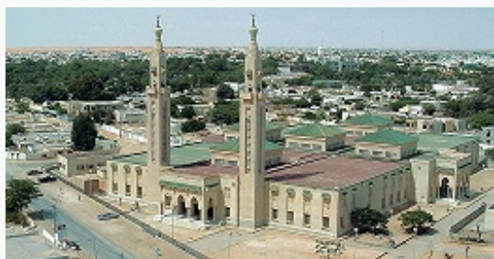
Главная мечеть в Нуакшоте.

Согласно Конституции М., гос. религией является ислам (ст. 5). Миссионерская деятельность др. религ. объединений запрещена. С 1980 законодательно введены шариат и суды кади . При президенте действует Высший исламский совет.