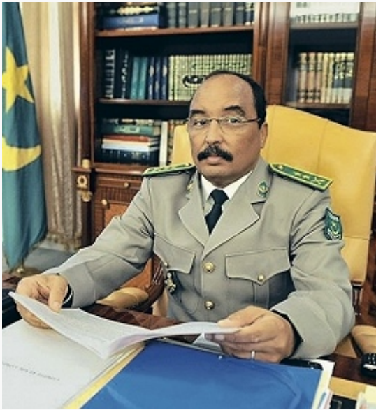
First Quantum Minerals Ltd. Президент Исламской Республики Мавритания Мохамед ульд Абдель Азиз.