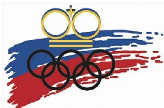
Эмблема Олимпийского и спортивного комитета Лихтенштейна.

Олимпийский и спортивный комитет создан и признан МОК в 1935. С 1936 (Берлин) спортсмены Л. участвовали во всех Олимпийских играх (за исключением Игр 1956, Мельбурн; 1980, Москва; 2008, Пекин) и в Олимпийских зимних играх (за исключением – 1952, Осло).