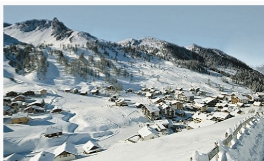
Principality of Liechtenstein Отроги хребта Ретикон (Ретийские Альпы).

песчаники, глинистые сланцы, брекчии. Имеются месторождения строит. известняков, глин, гипса.