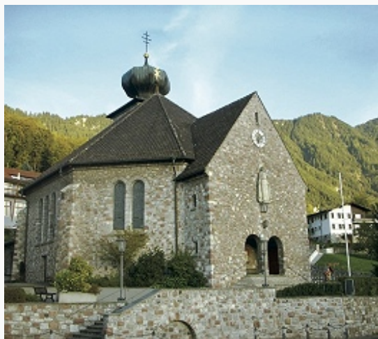
Тризенберг. Церковь Святого Иосифа. 1767–69.

Археологич. находки зооморфной пластики на территории Л. восходят к железному веку. В окрестностях городов Вадуц, Бальцерс, Шан и Нендельн сохранились остатки рим. фортификац. сооружений. К периоду Средневековья относятся замки Гутенберг в Бальцерсе (упоминается с 1263) и Вадуце (упоминается с 1322, разрушен в 1499, восстанавливался в 16 и 17 вв., реконструирован в 1905–12), также руины замков Шалун близ Вадуца, в Шелленберге,