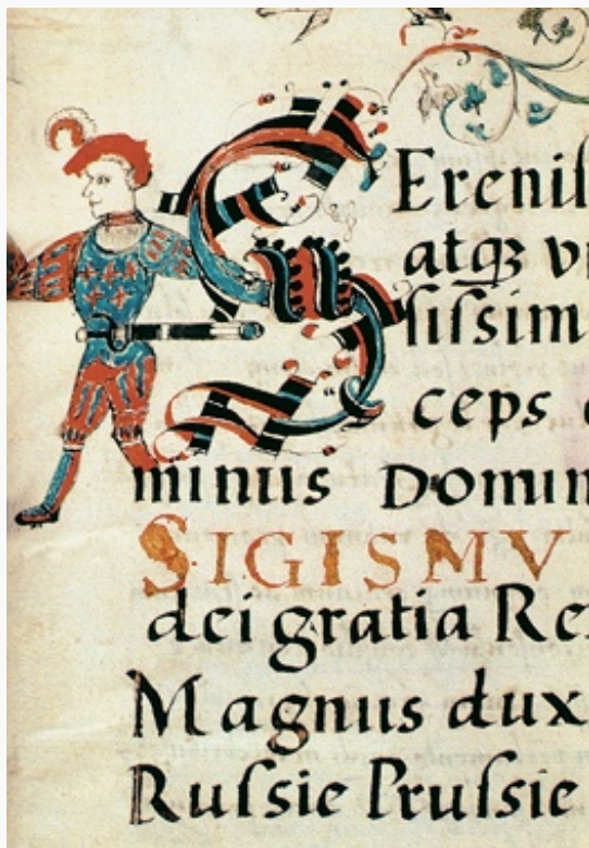
Инициал-миниатюра латинской редакции Первого Литовского статута. Список кон. 1530-х гг.