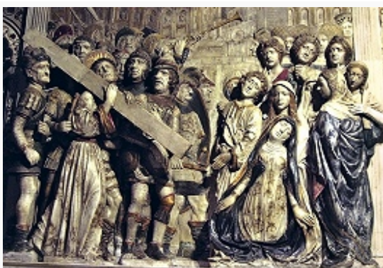
Ф. Лаурана. Алтарный образ «Несение креста». 1478–81.

ренессансного бюста, выявляющая индивидуальность модели, у Л. отступает перед абстрактным отношением к форме, проявляющемся в геометризации всех элементов, подчёркивании силуэтных линий и тонкой проработке поверхностей. Портреты имели выполненную окрашенным воском полихромную раскраску (сохранилась только на бюсте из Вены), придававшую им дополнит. натурализм и декоративность. С портретными бюстами связаны вырезанные в мраморе женские лицевые маски, посмертные или снятые с живой модели, оформленные как самостоят. произведения (Лувр; Метрополитен-музей, Нью-Йорк, и др.), назначение которых остаётся невыясненным. На основании сходства с женскими портретами Л. приписываются также мужские бюсты (Фернандо Арагонского, Боде-музей, Берлин; молодого мужчины, Новый музей, Стокгольм, и др.).