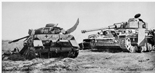
Подбитые немецко-фашистские танки. Курская дуга. 1943.

армию и оперативную группу «Кемпф» группы армий «Юг» (ген.-фельдм. Э. фон Манштейн ). Их поддерживала авиация герм. 4-го и 6-го возд. флотов. Всего группировка герм. войск насчитывала св. 900 тыс. чел., ок. 10 тыс. орудий и миномётов, ок. 2,7 тыс. танков и штурмовых орудий, св. 2 тыс. самолётов (ок. 70% танковых, до 30% моторизованных и св. 20% пех. дивизий, а также св. 65% боевых самолётов, действовавших на сов.-герм. фронте). Особые надежды герм. командование возлагало на применение новой боевой техники – танков «Тигр» и «Пантера», штурмовых орудий «Фердинанд», истребителей «Фокке-Вульф» FW-190D, штурмовиков «Хеншель» Hs-129 и др.