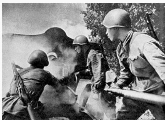
Прямой наводкой по врагу. Курская дуга. 1943.