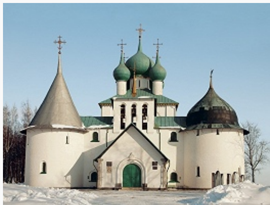
Церковь Сергия Радонежского на Куликовом поле. 1913–17. Архитектор А. В. Щусев. Фото 2009.

Столп-памятник Дмитрию Донскому. 1847–50. Архитектор А. П. Брюллов, инженер А. А. Фуллон. Фото 2009.