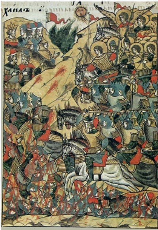
«Куликовская битва». Миниатюра из Лицевого летописного свода. 2-я пол. 16 в. Российская национальная библиотека (С.-Петербург).