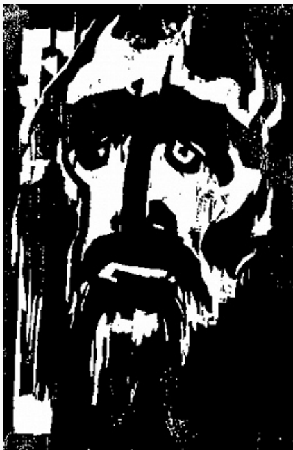
Ксилография. Э. Нольде. «Пророк». 1912.