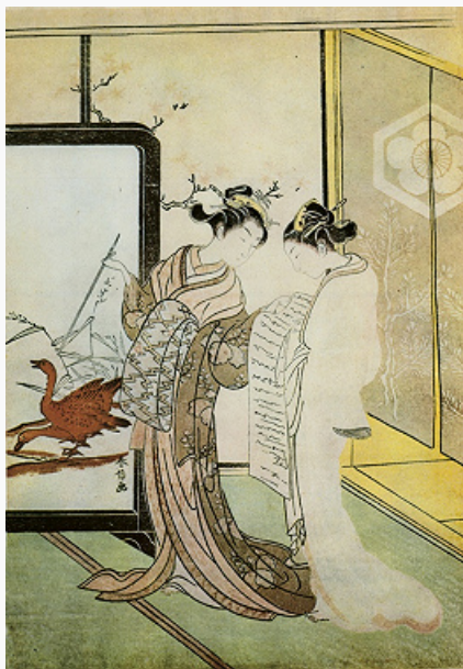
Ксилография. Харунобу Судзуки. «Две девушки с гусями». Сер. 18 в.

Авторы: С. И. Стефанов (техника ксилографии)