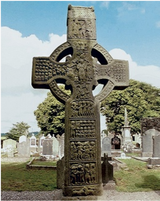
Крест Муйредаха. Камень. 10–11 вв. Монастербойс. Графство Лаут. Ирландия.

святых и т. п.). О более сложной мемориально-литургич. и репрезентативной функции монументальных К. можно судить по серии сооружений Франции и Англии 12–13 вв. Так, К. вдоль пути похоронной процессии Людовика IX Святого от Парижа до Сен-Дени (2-я пол. 13 в.; уничтожены в 16–18 вв., сохранился один) символизировали сакральность королевской власти, а также обозначали и охраняли путь паломников.