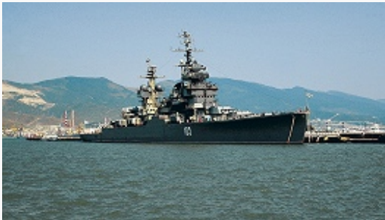
Крейсер «Михаил Кутузов», ныне филиал Музея Военно-Морского Флота РФ (г. Новороссийск). Фото 2008.

КРЕЙСЕР (голл. kruiser, от kruisen, букв. — двигаться разнонаправленно; от kruis — крест, перекрёсток), 1) боевой надводный корабль, предназначенный для действий в океанических (мор.) зонах, поиска и уничтожения ПЛ, надводных кораблей и судов противника, защиты своих мор. перевозок, обеспечения высадки мор. десантов, огневой поддержки сухопутных войск на мор. побережье и решения др. боевых задач. Как класс боевых кораблей К. появились в 1860-х гг. В рос. флоте с 1892 К. подразделялись на К. 1 ранга (броненосные и бронепалубные) и К. 2 ранга. С 1907 сведены в один ранг и подразделялись на броненосные К. и К., а с 1915 все корабли этого класса именовались К. В состав рос. ВМФ входили минные К., которые в 1907 переведены в класс эсминцев (см. в ст. Эскадренный миноносец ). В 1-ю мировую войну в составе флотов некоторых государств находились линейные К.,