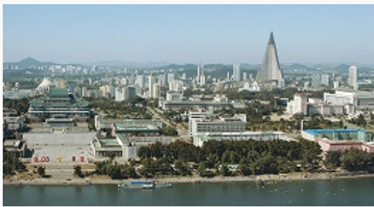
Панорама Пхеньяна.

С 1975 в стране действует всеобщее обязательное бесплатное 11-летнее обучение, включающее одногодичное дошкольное и 10-летнее школьное образование (4-летнее начальное и 6-летнее среднее), сочетающее общее среднее образование с проф.-техническим. Дошкольным обучением охвачено 45% детей, начальным – 93%, средним – 69%.