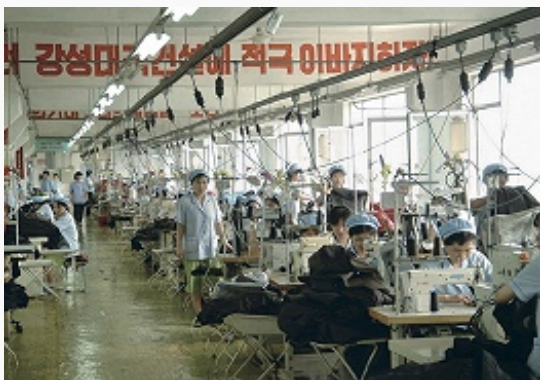
Швейная фабрика в Пхеньяне.

Лесозаготовки (ок. 600 тыс. м 3 в год) ведутся в осн. в горных районах на севере страны (более половины сосредоточено в пров. Янгандо), откуда древесина поступает на перерабатывающие заводы в городах Канге, Хесан, Кильччу, Хамхын, Синьиджу, Пхеньян (произ-во пиломатериалов 200–300 тыс. м 3 в год). Центры целлюлозно-бумажной пром-сти – Хэджу, Кильччу, Хверён, Хесан.