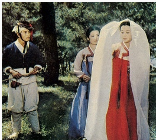
Кадр из фильма «Сказание о Чхунхян». Режиссёр Юн Ён Гю. 1959.

В 1947 в Пхеньяне основана киностудия (с 1948 гос.; с 1958 Кор. киностудия худож. и документальных фильмов). Первый снятый в КНДР полнометражный фильм – «Моя Родина» (1949, реж. Кан Хон Сик). На протяжении 1950-х гг. формировался специфич. стиль сев.-кор. кинематографа, сочетающий жанрово-тематич. стереотипы социалистич. реализма, мелодраматич. интонации раннего кор. кино и традиц. поведенческие каноны, основанные на этике конфуцианства . В 1959 осуществлена первая в КНДР экранизация – «Сказание о