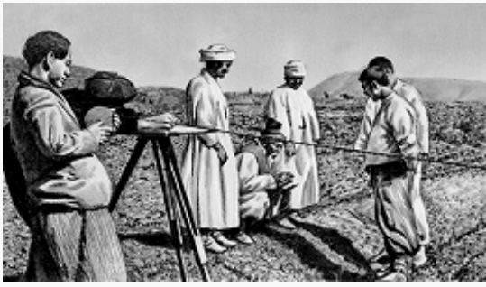
Крестьяне Северной Кореи получают земельные наделы. Фото. 2-я пол. 1940-х гг.

посетила сев.-кор. партийно-правительств. делегация во главе с Ким Ир Сенем. Было подписано Соглашение об экономич. и культурном сотрудничестве, по которому СССР обязался предоставить КНДР крупные кредиты (св. 800 млн. руб.).