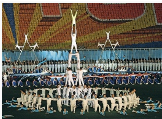
Открытие спортивного праздника.

Олимпийский к-т создан в 1953, признан МОК в 1957. В 1964 спортсмены КНДР впервые приняли участие в Олимпийских зимних играх в Инсбруке, там же конькобежка Пил Хва Хан стала первой спортсменкой в истории страны (и первой женщиной в Азии), удостоенной олимпийской награды (серебряная медаль на дистанции 3000 м).