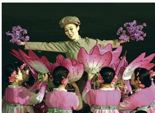
Праздник «Ариран». Сцена из театрализованного представления.

В 1947 в Пхеньяне были созданы Гос. театр (позднее Гос. драматич. театр) и училище при нём, в 1948 – Пхеньянский гор. театр, в 1949 – Молодёжный театр, Рабочий театр и др. В кон. 1940-х – нач. 1950-х гг. возник ряд театров, приписанных к министерствам и ведомствам (труппы Мин-ва транспорта, Мин-ва внутр. дел, Кор. нар. армии, Крестьянский театр и т. п.). Театральные коллективы появились также во многих провинциях. Во время Кор. войны 1950–53 создавались мобильные бригады, выступавшие в воинских частях. После войны в Пхеньяне построили театр «Моранбон», в 1960 открылся Большой театр. Первый Гос. театр кукол был открыт в Пхеньяне в 1948. С 1953 в большинстве провинций существуют небольшие стационарные театры кукол, призванные воспитывать детей в духе идей чучхе.