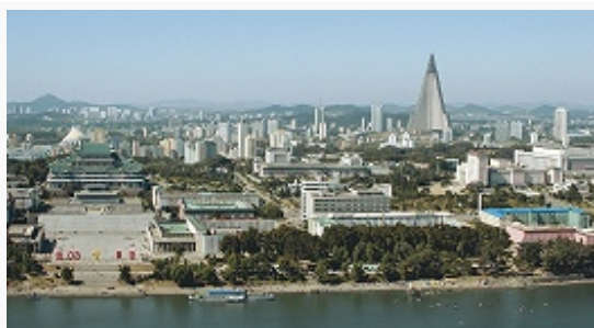
Панорама Пхеньяна.

С 1975 в стране действует всеобщее обязательное бесплатное 11-летнее обучение, включающее одногодичное дошкольное и 10-летнее школьное образование (4-летнее начальное и 6-летнее среднее), сочетающее общее среднее образование с проф.-техническим. Дошкольным обучением охвачено 45% детей, начальным – 93%, средним – 69%.