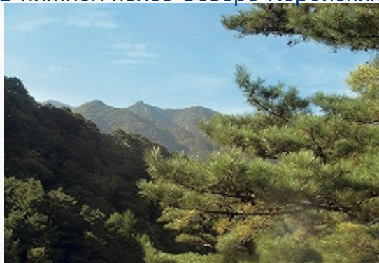
Горные хвойные леса.

В нижнем поясе Северо-Корейских гор (до выс. 500–800 м) распространены