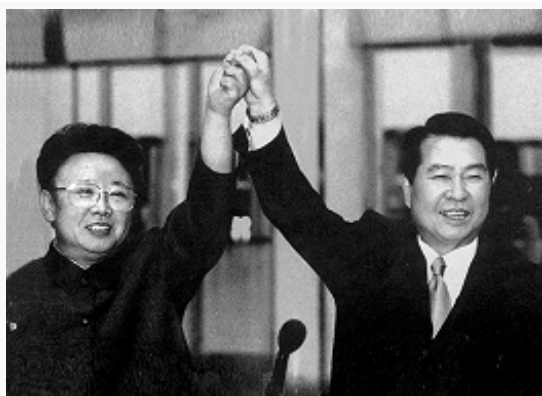
Встреча в Пхеньяне руководителя КНДР Ким Чен Ира (слева) и президента Республики Корея Ким Дэ Чжуна. Фото 2000.

В 1990-х гг. темпы экономич. развития КНДР продолжали снижаться. В 1987–1998 ВВП сократился с 22 до 9 млрд. долл. В 1995–97 в стране разразился голод, вызванный резким сокращением после стихийных бедствий урожая зерновых, гл. обр. риса. Следствием экономич. кризиса стала быстрая деиндустриализация страны. Несмотря на бедственное положение населения, правительство КНДР продолжало широко финансировать воен. строительство. 31.8.1998 оно провело испытания трёхступенчатой баллистич. ракеты (пролетела над территорией Японии и упала в Тихом ок.).