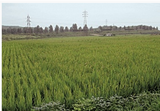
Рисовые поля на западе КНДР.

В 1960–90-е гг. преобладали крупные гос. и кооперативные хозяйства. Интенсивное использование минер. удобрений (вносились на 97% площадей поливных рисовых полей) привело к деградации почв и загрязнению поверхностных вод. С сер. 1990-х гг. резко сократилось использование с.-х. техники и объёмы вносимых удобрений; к нач. 21 в. почти все с.-х. работы велись вручную. С началом реформ в 2002 вместо коллективных хозяйств начали создавать семейные и частные предприятия. Природные катаклизмы сер. 1990-х – нач. 2000-х гг. (в т. ч. засухи 1995, 2000, 2001, 2006, 2008; наводнение 2007) привели к острой нехватке продовольствия (пик пришёлся на 1996–97). Продовольств. помощь КНДР оказывали страны Зап. Европы, США, Республика Корея и Япония; с 2006 безвозмездная помощь поступает из Республики Корея и Китая (б. ч. направляется на снабжение армии).