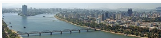
Пхеньян. Вид центральной части города.

Подавляющее большинство населения – корейцы (99,7%), проживают также китайцы (0,2%), есть небольшие группы филиппинцев, монголов, русских, вьетнамцев и др.