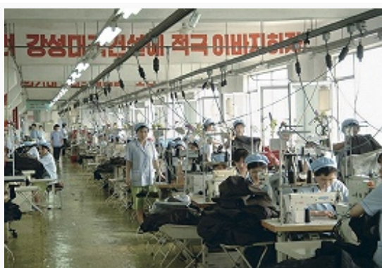
Швейная фабрика в Пхеньяне.

Лесозаготовки (ок. 600 тыс. м 3 в год) ведутся в осн. в горных районах на севере страны (более половины сосредоточено в пров. Янгандо), откуда древесина поступает на перерабатывающие заводы в городах Канге, Хесан, Кильччу, Хамхын, Синьиджу, Пхеньян (произ-во пиломатериалов 200–300 тыс. м 3 в год). Центры целлюлозно-бумажной пром-сти – Хэджу, Кильччу, Хверён, Хесан.