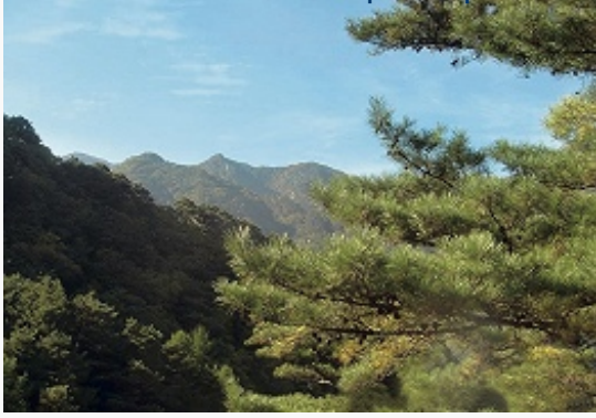
Горные хвойные леса.

В нижнем поясе Северо-Корейских гор (до выс. 500–800 м) распространены