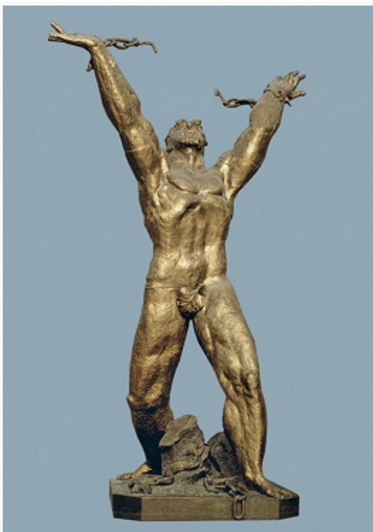
С. Т. Конёнков. «Освобождённый человек» («Самсон»). Гипс тонированный. 1947. Русский музей (С.-Петербург).

После 1917 К. принимал активное участие в осуществлении Монументальной пропаганды плана , был одним из организаторов и пред. Моск. проф. союза скульпторов-художников (1917–19); стоял у истоков сов. монументальной скульптуры. Создал мемориальную доску «Павшим за мир и братство народов» для Сенатской башни Моск. Кремля и композицию «Степан Разин со своей дружиной» для Красной пл. (дерево, 1919; обе – ГРМ).