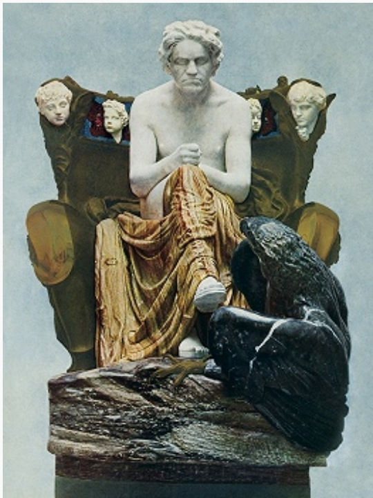
М. Клингер. «Бетховен». Алебастр, мрамор, бронза. 1899–1902. Музей изобразительных искусств (Лейпциг).

человечества получает развитие в работах К. «Голубой час» (1890, Музей изобразит. искусств, Лейпциг), «Источник» (1891–92, КГ, Дрезден), в триптихе «Воспоминание о Париже» (1908, Худож.-историч. музей, Вена). Фигуры юношей и девушек в пейзаже, то застывшие в неподвижности, то словно плывущие в медленном танце, призваны олицетворять у К. красоту воображаемого мира. Ритмика контуров, распределение цветовых пятен играют значит. роль в декоративно-плоскостном решении композиций. В триптихе «Христос на Олимпе» (1897, Музей изобразит. искусств, Лейпциг), где живопись сочетается со скульптурными орнаментальными деталями, нашла выражение идея синтеза разл. видов искусств, занимавшая важное место в эстетике символизма.