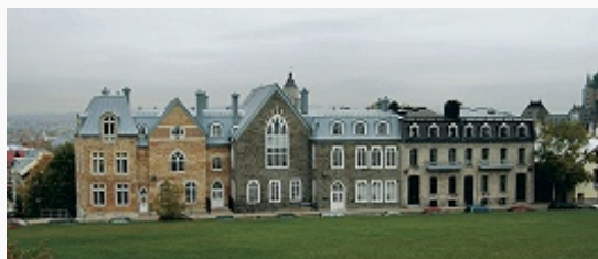
Квебек. Застройка Верхнего города. 17–18 вв.

конфедерации. С 1867 столица одноим. провинции. Место проведения Квебекских конференций 1943–44.