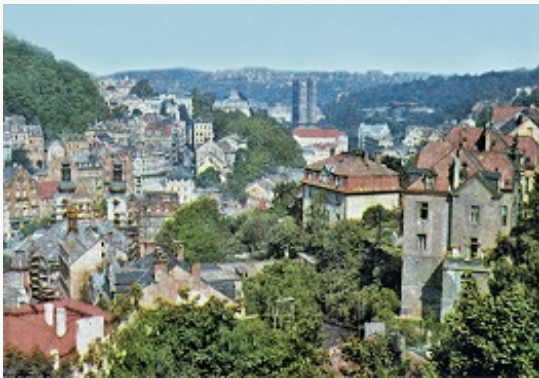
Карлови-Вари. Общий вид курорта.

КАРЛОВИ-ВАРИ (Karlovy Vary), город на западе Чехии, адм. центр Карловарского края. Нас. 50,8 тыс. чел. (2008). Расположен в долине р. Огрже [бассейн Лабы (Эльбы)] при впадении в неё р. Тепла. Один из наиболее известных бальнеологич. курортов Европы. Центр междунар. туризма. Ж.-д. станция. Междунар. аэропорт.