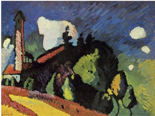
В. В. Кандинский. «Пейзаж с башней». 1908. Национальный музей современного искусства (Париж).

Исполнял также акварели, выставочные плакаты, ксилографии: «Стихи без слов» (1903, изд. 1904); книга стихотворений К. в прозе «Звуки» («Klänge») с авторскими иллюстрациями (1913). В поэзии К. соединились черты символистской и экспрессионистич. поэтики, а также футуристич. зауми . Длительные дружеские отношения, базировавшиеся на неизменном интересе К. к музыке, связывали его с А. Шёнбергом .