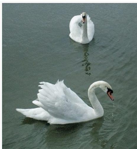
Лебеди-шипуны в водах Куршского залива.

Леса занимают 18,3% территории области (2003). Осн. лесообразующие породы: ель, сосна, дуб, клён, берёза, ольха. Наиболее широко распространены еловые леса (до 25% лесопокрытой площади; гл. обр. в вост. части К. о.) и березняки (в осн. кисличные и травяные). Сосновые леса (17% лесопокрытой площади) доминируют на Куршской и Балтийской косах. Встречаются отд. небольшие массивы дубрав, ясеневых лесов, липняков и незначит. участки буковых лесов. В понижениях рельефа в условиях длительного избыточного увлажнения произрастают черноольшаники. В составе древесно-кустарниковой флоры значительна доля интродуциров. видов (бархат амурский, можжевельник крымский, тюльпанное дерево и др.); для закрепления дюнных песков на Куршской косе в культуру были введены сосны (горная и чёрная), ель канадская и др. Ок. \frac{1}{3} территории занимают сенокосные и пастбищные луга (до 30 видов кормовых трав, в т. ч. полевица, овсяница, ежа сборная, мятлик, клевер, люцерна, мышиный горошек, чина луговая) с высокой урожайностью (до 40 ц/га на пойменных сенокосных лугах).