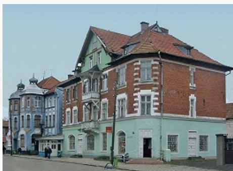
Улица в Зеленоградске.

Архит. наследие К. о. включает остатки построек 13–16 вв.: крепостей Бальга, Прёйсиш-Эйлау, Инстербург, Рагнит, Шаакен, Нойхаузен, Бранденбург и др.; церковных зданий, в т. ч. в посёлках Владимирово, Гвардейское (возвращено лютеранской общине, в 1993–2000 отреставрировано), Родники Гурьевского р-на, Храброво, Романово, Сальское, Тургенево, в Гурьевске, Правдинске (в 1990 передано православной общине). Крепость Пиллау в Балтийске строилась с 1626 (ныне филиал Музея Балт. флота). Сохранились значит. фрагменты историч. гор. застройки (в Калининграде, Озёрске, Советске, Гусеве и др.), усадебных комплексов 18 – нач. 20 вв., курортной архитектуры (в т. ч. нач. 20 в. в Светлогорском р-не), хозяйств. и инж. сооружений [маяк в Балтийске (1813–1816); ж. д. вокзал в Калининграде (1929, арх. Э. Рихтер, восстановлен в 1949); мост «Королева Луиза» в Советске (1907, реставрация портала 2002–2003)]. После 1945 в К. о. велось жилищное строительство по типовым проектам, осуществлялись реконструкция и переоборудование историч. зданий, в т. ч. в Калининграде – реконструкция кирхи Св. семейства (1904–07, арх. Ф. Хайтман)