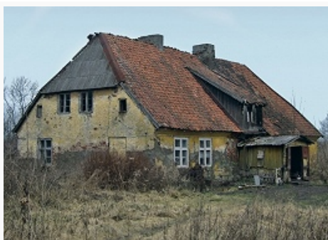
Гурьевский район. Характерная сельская застройка 1920–30-х гг.