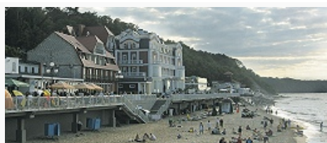
Пляж в районе Светлогорска.

Производители продовольствия испытывают сильную конкуренцию со стороны импортёров более дешёвых продуктов питания из соседних стран, прежде всего из Польши. Большая часть с.-х. угодий (св. 75%, 2006) относится к землям с.-х. организаций, крестьянские (фермерские) хозяйства занимают 11,4%, в личном пользовании граждан – 10,8%. В с.-х. организациях производится (%): зерна 83,6, скота и птицы на убой 71,4, молока ок. 40; в хозяйствах населения – картофеля 81,2, овощей ок. 90, скота и птицы на убой 25,4, молока 57,5.