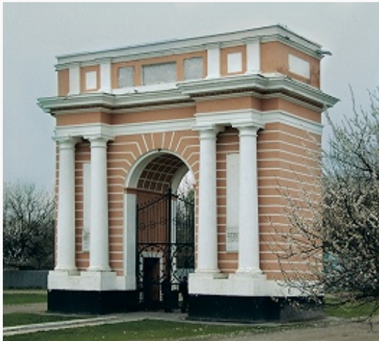
Триумфальная арка в станице Екатериноградская. 1785 (реставрирована в 1847, 1962).

Безенгийского (ср.-век. цитадель Тотур-Кала, замок Джабоевых и др.). В Малой Кабарде находятся руины аланской крепости (у селения Кременчуг-Константиновское; возникла на развалинах ещё более древних сооружений) и городищ (близ станицы Солдатской, с. Верхний Акбаш и др.). Достопримечательностью станицы Екатериноградской является триумфальная арка, построенная к приезду имп. Екатерины II на Кавказ (1785; реставрирована в 1847, 1962).