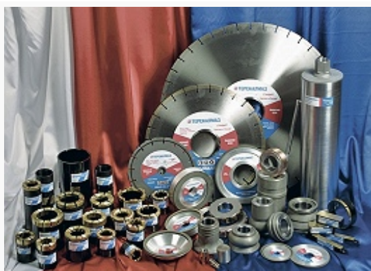
Продукция предприятия «Терекалмаз». ОАО «Терекалмаз»

проектная мощность 65,1 МВт), входят в компанию «ГидроОГК». Св. \frac{2}{3} потребляемой электроэнергии поставляется из Ставропольского края и Ростовской области.