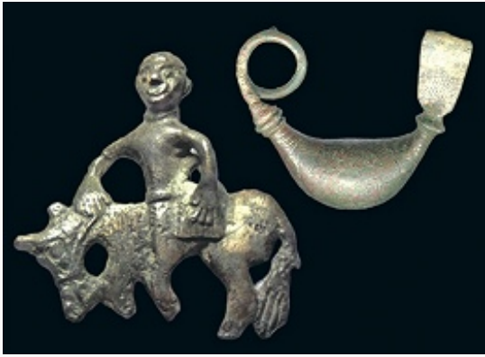
Бронзовые фигурка всадника и фибула 7–6 и 8 вв. до н. э. (по Б. Х. Атабиеву).