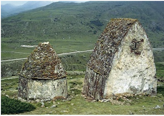
Наземные склепы-кешенеу села Верхний Чегем. 2-я пол. 18 в.

Грозным. Контакты балк. владетелей с Рус. гос-вом начались в 17 в. и носили эпизодический характер. Господствующей религией среди кабардинцев и балкарцев постепенно в 16–18 вв. (согласно др. точке зрения, в кон. 17 – нач. 19 вв.) стал ислам.