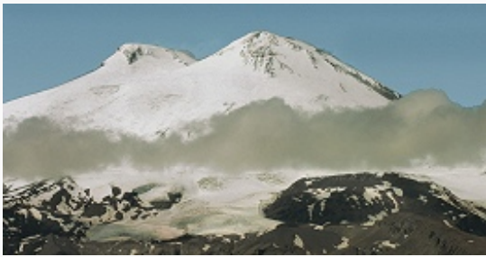
Гора Эльбрус.

Рельеф К.-Б. расположена в центр. части Предкавказья и сев. макросклона Большого Кавказа . Для рельефа характерны сложность и ярусность при общем подъёме территории с северо-востока на юго-запад. Миним. выс. 150 м (долина р. Терек в районе с. Хамидие), макс. – 5642 м (гора Эльбрус – высшая точка России).