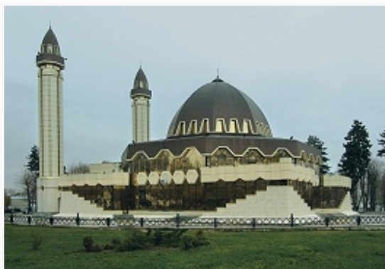
Соборная мечеть в Нальчике. 2004.

Большинство верующих К.-Б. – мусульмане-сунниты. Зарегистрировано 124 мусульм. общины (на 1.1.2007). При Духовном управлении мусульман К.-Б. действует Исламский ин-т, в котором обучается более 50 студентов. Следующей конфессией по числу приверженцев является православие (19 православных общин Ставропольской и Владикавказской епархии РПЦ; действуют 11 воскресных школ). В республике