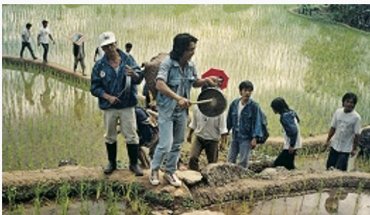
Ифугао. Похоронная процессия движется по бровкам рисовых полей к месту захоронения. Деревня Анао (муниципалитет Хингйон, провинция Ифугао), 1995.

80% белковой пищи составляли съедобные улитки; ели также саранчу, термитов и др. Развиты резьба по дереву, плетение из бамбука и ротанга, сохраняется кузнечное ремесло (у мужчин), ткачество из хлопка на наспинном станке (у женщин); распространена техника икат, вышивка); гончарство утрачено.