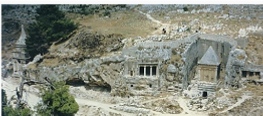
Гробницы долины Кидрона: слева – т. н. Колонна Авессалома,

восстанавливался; в 70-х гг. н. э. разрушен римлянами окончательно; сохранилась часть храмовой платформы времени Ирода I – Зап. стена, или Стена Плача (с несущими арками), гл. святыня иудаизма. Близ Яффских ворот – Цитадель (т. н. Башня Давида), возведённая на месте постройки Ирода I (перестраивалась в 14–16 вв.; ныне Музей истории И.). В евр. квартале – остатки центр. улицы (Кардо) рим. колонии Элия Капитолина с колоннами и арками, восстановленные жилые дома иродианского периода и синагоги, в т. ч. древнейшая – Рамбана (1267), комплекс из 4 сефардских синагог (16 в.), руины синагоги Хурва (18 в.).