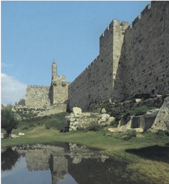
Стена Старого города. На заднем плане – Цитадель («Башня Давида»).

быстро расти. В 1860 за пределами гор. стены началось строительство Нового города, скоро превысившего по размерам старую часть И. Евреи с сер. 19 в. составляли половину населения И., христиане и мусульмане – по 25%. Общая численность жителей И. на нач. 20 в. достигала 50 тыс. чел.