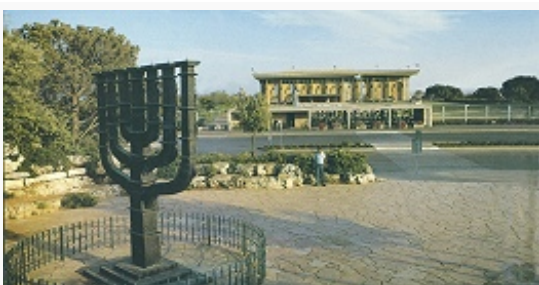
Площадь перед зданием кнессета.

мусульманским кладбищем, вост. склон, поднимающийся на Масличную гору, – древнейшим в мире евр. кладбищем.