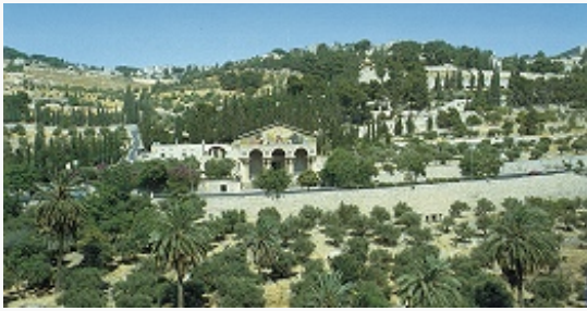
Панорама Масличной горы. На переднем плане – «Церковь всех наций», на дальнем плане – церковь Св. Марии Магдалины.