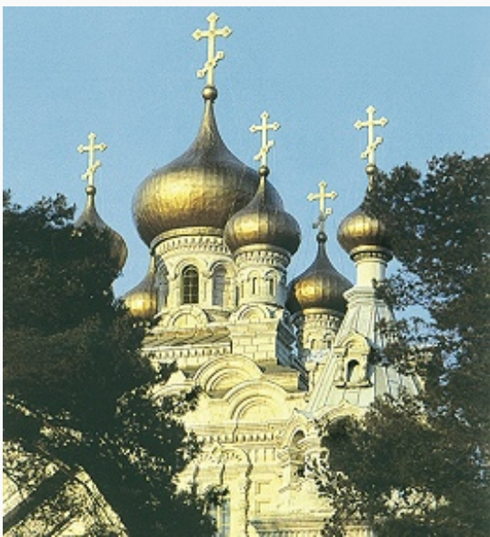
Церковь Святой Марии Магдалины на Масличной горе. 1885–88.

мусульманским кладбищем, вост. склон, поднимающийся на Масличную гору, – древнейшим в мире евр. кладбищем.