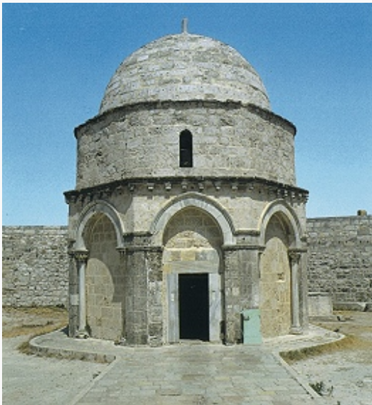
Церковь Вознесения на Масличной горе. 12 в. (перестроена в 13 в.).