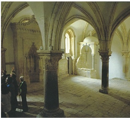
Сионская горница (т. н. Сенакулум).

Богородицы (Неа, 543). В арм. квартале находятся кафедральный собор Св. Иакова Старшего (12 в.) и Армянский патриархат. Здесь открыты остатки дворца Ирода I и королевского дворца эпохи крестоносцев.