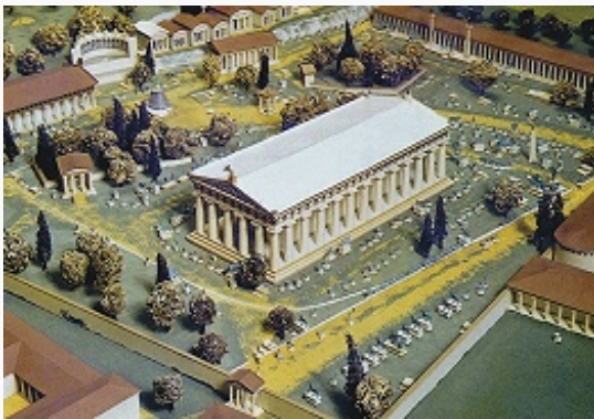
Реконструкция святилища в