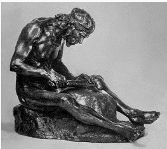
Г. Р. Залеман. «Каменный век». Бронза. 1899. Русский музей (С.- Петербург).

Гуго Романович (Робертович) [7(19).6.1859, С.-Петербург – апр. 1919, Петроград], акад. петерб. АХ (1889). Учился там же (1877–84). В 1885–89 – пенсионер АХ за границей, посетил Дрезден и Мюнхен, работал в осн. в Риме и Флоренции. Исполнял в позднеакадемической манере работы на религ. и мифологич. темы (барельефы «Блудный сын», воск, 1881, ГРМ, и «Переправа через Стикс», гипс, 1887, Музей РАХ; группа «Борьба кимвров с римлянами», гипс, 1889, ГРМ), серию, изображающую первобытного человека («Каменный век»,