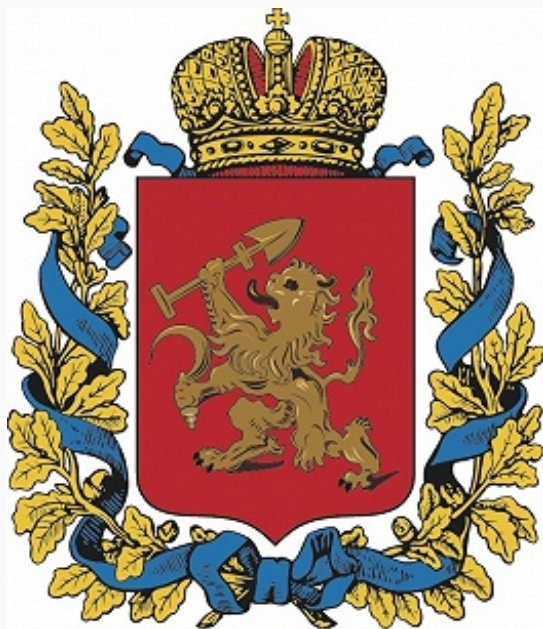
Герб Енисейской губернии.

ЕНИСЕЙСКАЯ ГУБЕРНИЯ, в России адм.-терр. единица в Сибири. Образована в 1822 в ходе Сперанского реформ . Входила в состав генерал-губернаторства Вост. Сибири (1822–87), Иркутского генерал-губернаторства (1887–1917). Центр – г. Красноярск. К кон. 19 в. включала Ачинский, Енисейский (с Туруханским приставством), Канский, Красноярский, Минусинский уезды, Усинский пограничный округ. Пл. 2542,3 км 2 (1897). Нас. 559,9 тыс. чел., в т. ч. русские, якуты, тунгусы, татары (1897), 787,7 тыс. чел. (1908). В 19 – нач. 20 вв. Е. г. – место ссылки (57,4 тыс. ссыльных в 1899, в т. ч. В. И. Ленин в 1898–1900, И. В. Сталин в 1913–17). С 1860-х гг. район крестьянского переселения (к 1900 из Европейской России переселилось ок. 150 тыс. чел., в 1900–14 – ок. 315 тыс. чел.). Осн. занятие населения – земледелие, развитое гл. обр. в Ачинском, Канском, Красноярском, Минусинском уездах; посевные площади – 389 тыс. га (1900), гл. культуры – рожь, пшеница, ячмень, просо. Е. г. полностью обеспечивала себя хлебом, часть его вывозилась в Иркутскую губ. и Забайкальскую обл. На юге Е. г. было развито товарное животноводство. Значительную роль в жизни