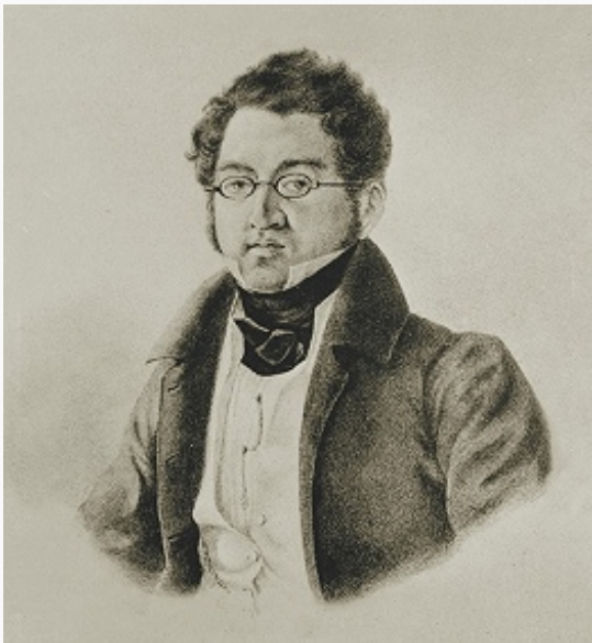
М. А. Дондуков-Корсаков.