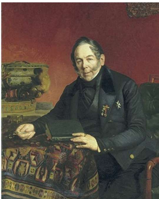
Н. И. Дондуков-Корсаков. Портрет работы Ф. О. Будкина. 1841. Русский музей (С.-Петербург).

всем им повелено именоваться князьями Дондуковыми. По указу 8(19).3.1762 Вера Дондукова получила разрешение уехать из С.-Петербурга, поселиться в Енотаевске и вступить в управление Бага-Цохурским улусом калмыков, а сопровождать её дозволено второму сыну – полковнику Алексею Дондуковичу Дондукову (ок. 1733–1781), который после смерти матери управлял калмыками Бага-Цохурского и Эркетеневского улусов. Ещё один сын В. Дондуковой – Иона Фёдорович (ок. 1734–1781), бригадир, служил в л.-гв. Преображенском полку. От брака с Марией Васильевной Корсаковой [3(14).8.1756–21.12.1831(2.1.1832)] он имел единственную