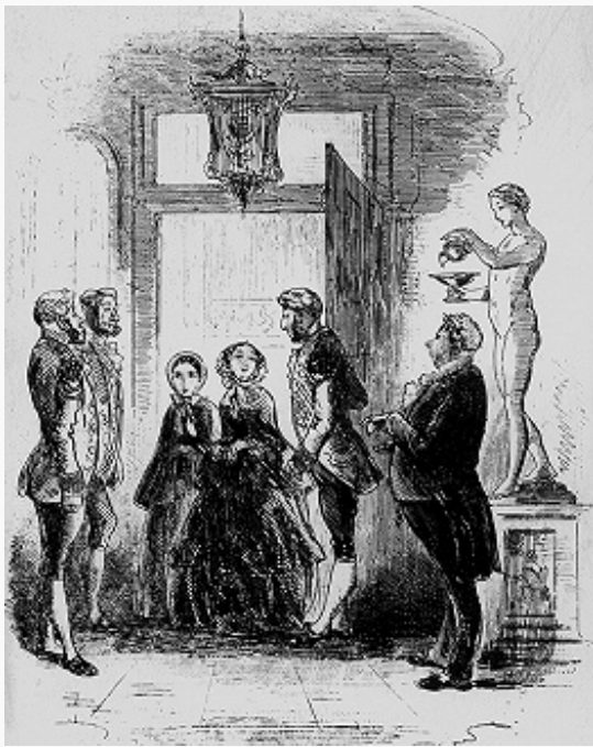
Ч. Диккенс. Фронтиспис работы Х. К. Брауна к роману «Крошка Доррит» (Лондон, 1867).

алчности взрослых, преступному миру лондонских трущоб. Др. ранние сочинения Д. – авантурный роман «Жизнь и приключения Николаса Никльби» («The life and adventures of Nicholas Nickleby», 1838–39), роман-сказка «Лавка древностей» («The old curiosity shop», 1841), идеализирующий детский характер, – построены на чётком противопоставлении положительных и отрицательных героев и также пронизаны верой в победу добра над злом. Романы Д. поначалу печатались в периодике по частям; сопровождалась иллюстрациями [наиболее известны работы Физа (Х. К. Брауна) и Дж. Крукшанка]. Сочиняя романы, Д. «опережал» читателей всего лишь