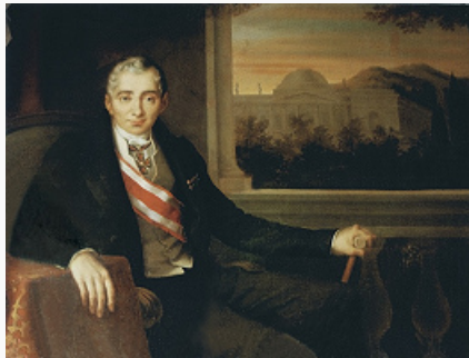
Н. Н. Демидов. Портрет работы К. Морелли. 1840. Нижнетагильский музей-заповедник.

Петровское (Княжищево, ныне в Наро-Фоминском р-не; арх. М. Ф.