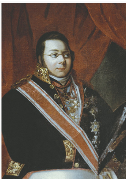
П. Н. Демидов. Портрет работы

Из потомков Петра Г. Демидова известен его правнук – Михаил Денисович [8(20).11.1842–25.9(7.10).1898], тайн. сов. (1896), вице-губернатор Рязанской (1882–88) и С.-Петерб. (1888–1892) губерний, губернатор Олонецкой губ. (1892–98).