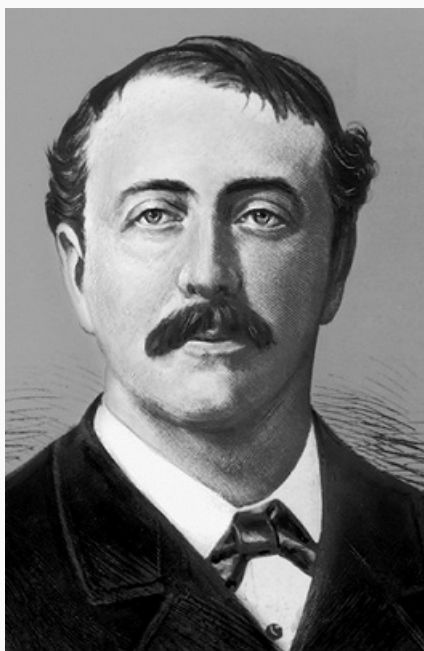
П. П. Демидов.

к 1773; плавка не начата). Все 4 завода были сожжены во время Пугачёва восстания 1773–75 ; нанесённый ущерб, по оценке владельца, превысил 230 тыс. руб. Восстановил и пустил Кагинский (1775), Нижний (1776) и Верхний (1778) Авзянопетровские заводы. Кухтурский завод восстановлен не был, вместо него в 1777 был запущен Верхнеузьянский на р. Верхний Узьян. Его брат – Никита Никитич [1728–20.12.1804(1.1.1805)], построил Асят-Уфимский чугуноплавильный завод, его переписка с управляющими заводами (опубл. в 1861) является ценным историч. источником. Их внучатый племянник – Николай Иванович [19(30).8.1771–4(16).7.1833], ген. от инф. (1828), шеф Петровского мушкетёрного (с 1811 пехотного) полка (1803–1814), отличился в ходе рус.-швед. войны 1808–09, сумев возвратить захваченный шведами г. Ваза (награждён орденом Св. Георгия 3-й степени), нач. 21-й пех. (1809–17) и 1-й гренадерской (1817–24) дивизий. Ген.-адъютант (1825), сенатор (1826). Член К-та для составления воинского устава (с 1826), гл. директор Пажеского корпуса, кадетских корпусов и Дворянского полка, член К-та о военно-учебных заведениях (1826–31) и Совета о воен. училищах (с 1830 Совет о военно-учебных заведениях) (1826–33), в 1828–30 командовал войсками, остававшимися в С.-Петербурге во время рус.-тур. войны 1828–29.