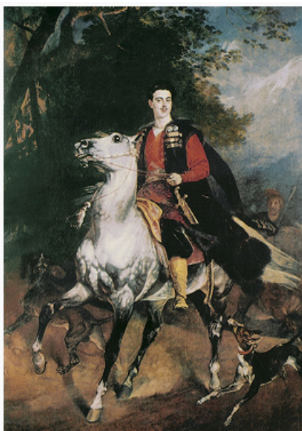
«А. Н. Демидов на коне». Портрет работы К. П. Брюллова. 1830-е гг. Галерея современного искусства (Палаццо Питти, Флоренция).