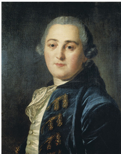
Н. А. Демидов. Портрет работы Ф. С. Рокотова. 1760-е гг. Пермская художественная галерея.