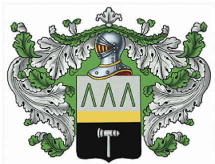
Герб рода дворян Демидовых.

Авторы: И. Н. Юркин (17 – 1-я пол. 19 вв.); А. П. Пятнов (1-я пол. 19–20 вв.)