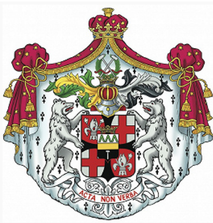
Герб рода светлейших князей Лопухиных-Демидовых.