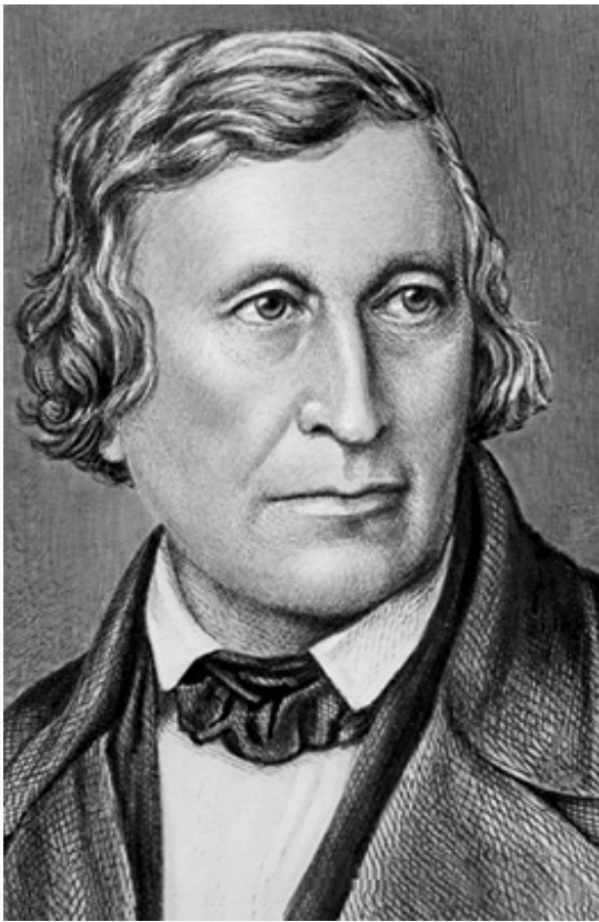
В. К. Гримм.

способствовали становлению мифологической школы в нем. литературоведении и фольклористики как науки. Бр. Г. предприняли издание ср.-век. текстов: «Бедный Генрих» Гартмана фон Ауэ (1815), «Рейнеке-Лис» («Reinhart Fuchs», 1834), «Песнь о Роланде» («Ruolandes liet», 1838) и др. Якоб Гримм – автор исследования «О старонемецком майстергезанге» («Über den altdeutschen Meistergesang», 1811). Вильгельму Гримму принадлежит труд «Германские героические сказания» («Die deutsche Heldensage», 1829).