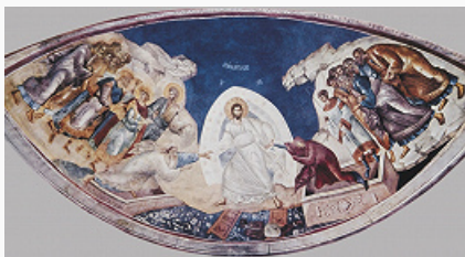
«Сошествие во ад». Фреска в апсиде кафоликона монастыря Хора (Кахрие-джами) в Константинополе (Стамбул). Ок. 1316–21.