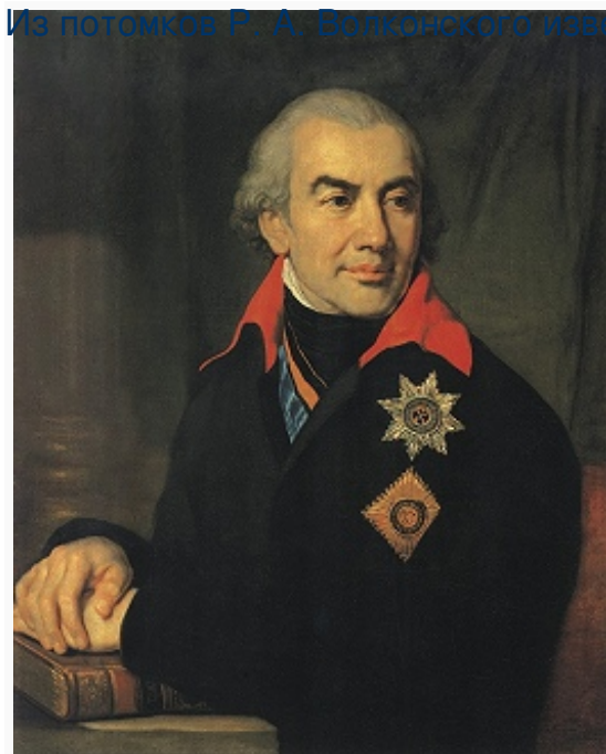
Г. С. Волконский. Портрет работы В. Л. Боровиковского. 1810-е гг. Тульский областной художественный музей.