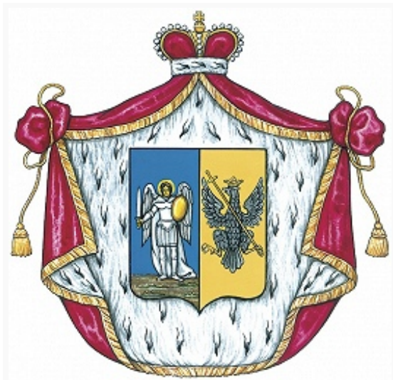
Герб рода князей Волконских.

ВОЛКОНСКИЕ, рос. княжеский род, Рюриковичи . Ведут своё происхождение от тарусского и оболенского кн. Юрия Михайловича, 5-го сына киевского и черниговского кн. Михаила Всеволодовича . Между 1307 и 1325 внук Юрия Михайловича кн. Иван Юрьевич Толстая Голова, владевший вместе с родными братьями «дольницами» в Тарусском кн-ве, участвовал в продаже митр. Петру ряда родовых земель в верховьях р. Ока. В 14 в. его потомки находились в союзе с Московским вел. кн-вом. Внук кн. Ивана – кн. Константин Юрьевич (? – 1368) погиб, защищая Оболенск, во время похода литов. кн. Ольгерда , а его младшие братья – тарусские князья Фёдор Юрьевич (родоначальник Конинских и В.) и Мстислав Юрьевич (родоначальник Спажских) – в Куликовской битве 1380 .