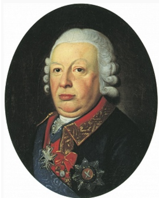
М. Н. Волконский. Портрет работы неизвестного художника. 2-я пол. 18 в.