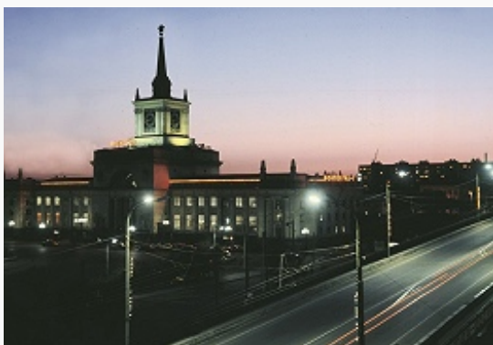
Здание железнодорожного вокзала в Волгограде. 1951–54. Архитекторы А. В. Куровский, С. З. Брискин.

постройки нем. колонии Старая Сарепта (18 – нач. 20 вв.; ныне историко-этнографич. и архит. музей-заповедник) в Волгограде; ц.