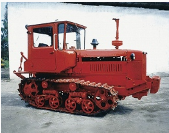
Продукция Волгоградского тракторного завода (трактор ДТ-75).