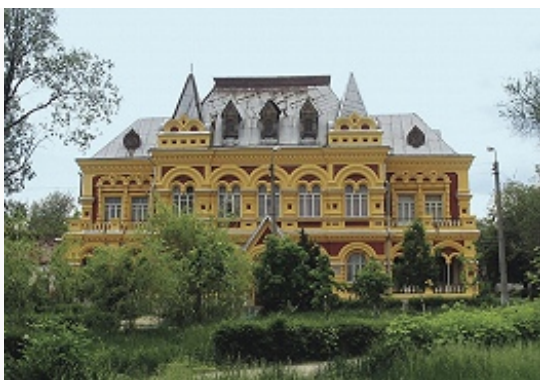
Здание краеведческого музея в Камышине.