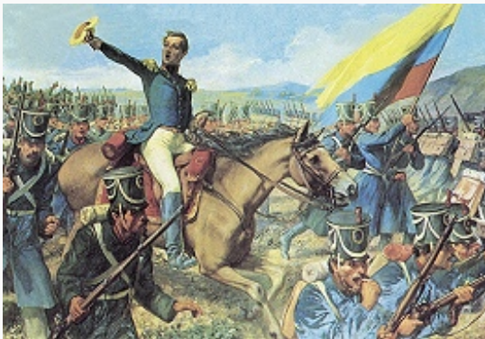
Битва при Аякучо. 1824. Работа неизвестного художника. Музей Боготы.

Гранады, которую создали С. Боливар и А. Нариньо . В 1811 в пров. Вост. берег (Уругвай) начала действовать повстанч. армия во главе с Х. Артигасом , сумевшая через три года изгнать испанцев со своей территории. В Чили власть патриотов сохранялась с сент. 1810 по окт. 1814. Наиболее ожесточённый характер на этом этапе войны приобрела борьба за нац. независимость в Новой Испании, которую возглавили М. Идальго-и-Костилья и Х. Морелос-и-Павон. Первый этап войны завершился повсюду (кроме Ла-Платы) восстановлением власти испанской колониальной администрации. Поражение освободит. движения было обусловлено несогласованностью действий восставших, разл. пониманием участниками движения социально-политич. задач, а также реставрацией старой власти в самой Испании,