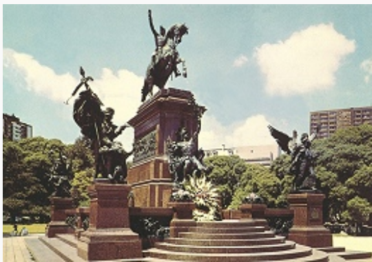
Памятник Х. де Сан-Мартину и освободительным армиям в Буэнос-Айресе. Скульптор Г. Эберлейн. 1910.

Оккупация Испании наполеоновскими войсками весной 1808 привела к острому политич. кризису в этой стране и образованию вакуума власти в исп. колониях в Америке. Этим воспользовались креолы, которые консолидировались и в 1810 начали борьбу за независимость. Образовались три осн. очага войны: б. ч. вице-королевства Ла-Плата (совр. Аргентина, Парагвай и Уругвай), Андские страны (Венесуэла, Новая Гранада – совр. Колумбия, Чили, Перу и Кито – совр. Эквадор) и Новая Испания (Мексика). Восстания не имели общего руководящего центра, деятельность повстанцев никак не координировалась. Инициаторами вооруж. выступлений повсюду являлись землевладельцы-креолы, торговцы, ремесленники и интеллигенция. В ряде районов к ним примкнули крестьяне и рабы, а в Новой Испании крестьянские массы превратились на два года (1813–15) в ведущую силу освободит. движения.