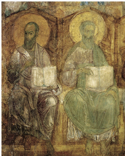
Владими́ро-сузда́льская школа. «Павел и Матфей». Фрагмент фрески в Дмитриевском соборе во Владимире. Ок. 1197.