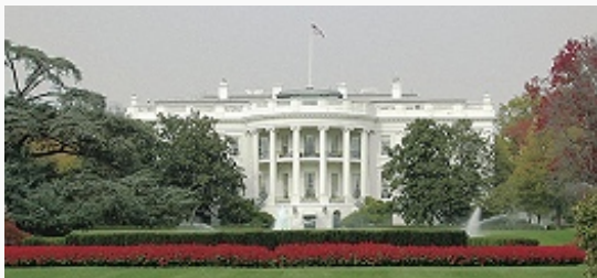
Белый дом. 1792–1829.

реконструкции и развития и др. междунар. организации. Место проведения мн. междунар. конференций, в т. ч. Вашингтонской конференции 1921–22 . Традиц. место проведения массовых обществ.-политич. мероприятий – маршей, манифестаций, митингов и т. д.