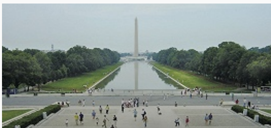
Памятник Дж. Вашингтону. 1848– 84. Архитектор Р. Миллс.

Первоначальный план В. составил в 1791–93 арх. П. Ш. Ланфан при участии Т. Джефферсона . Площадка размером 10×10 миль, отведённая под строительство города, была расчерчена прямоугольной сеткой улиц («стрит») и диагоналями проспектов («авеню»; позже квадрат гор. территории был нарушен, в 1847 правобережье р. Потомак возвращено штату Виргиния). Гл. оси соединяют возведённый на холме Капитолий с расположенным на равнинной местности Белым домом (Пенсильвания-авеню) и ансамблем памятников Дж. Вашингтону (мраморный обелиск, 1848–84, арх. Р. Миллс) и А. Линкольну (дорич. периптер , 1915–22, арх. Г. Бэкон,