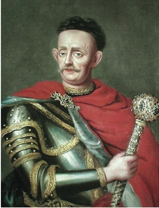
«Гетман Мазепа с булавой». Портрет работы неизвестного художника. 18 в. Музей истории Запорожья (г. Запорожье).