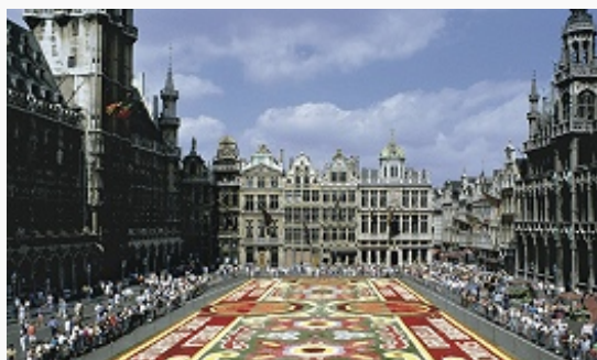
Брюссель. Площадь Гранд-плас со зданием Ратуши (слева) во время майской выставки цветов.

ныне Гор. историч. музей), а также гильдейскими домами (кон. 17 – нач. 18 вв.), в числе которых – обширный дворец, т. н. Дом герцогов Брабантских (назв. – от изображений брабантских правителей на базах пилястров; 1698, инж. Г. де Брёйн). Достопримечательность центра Б. – статуя Маннекен-Пис (1619, И. Дюкенау).