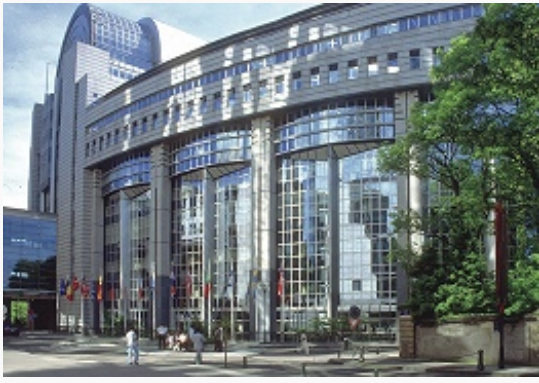
Брюссель. Европейский парламент. 1995.

финансово-пром. корпораций Б. не имеет аналогов среди др. городов мира; здесь сосредоточено ок. \frac{2}{3} общего числа банковских служащих страны и ок. \frac{1}{4} всех занятых в торговле. Промышленность в пределах Столичного региона связана с обслуживанием населения или выпуском высококачественной продукции машиностроения (автосборочные заводы, произ-во телекоммуникационного