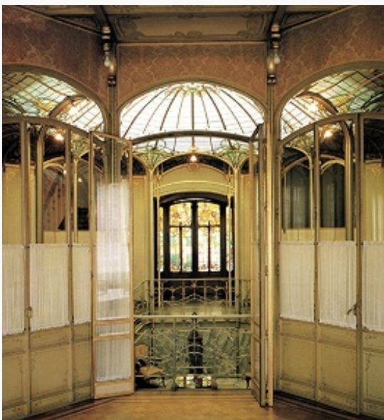
Брюссель. Вестибюль отеля ван Этвелде. 1895–97. Архитектор В. Орта.

Памятники периода эклектизма: галереи Св. Губерта – первый в Европе пассаж (1837–47, 1864, арх. Я. П. Клёйсена), Биржа (1866–83, арх. Л. П. Сёйс), Дворец Правосудия (1866–83, арх. Ж. Пуларт), Дворец 50-летия, в комплекс которого входят Королевский музей армии и воен. истории (1810) и Королевский музей искусств и истории (основан в 1835; здание 1880, арх. Ж. Бордио), объединённые Триумфальной аркой (1905, арх. Ш. Жиро; квадрига – скульптор Т. Венсотт).