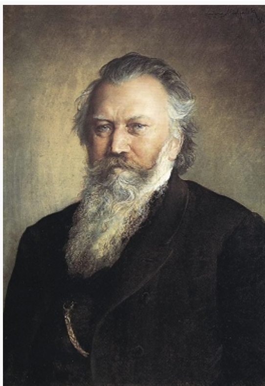
И. Брамс. Портрет работы Л. Михалека. 1891. Государственная и университетская библиотека (Гамбург).

2-й фп. (B-dur, 1881, в 4 частях) концерты с оркестром были написаны после путешествий в Италию. Симфонич. произведения Б. привлекли внимание ведущих дирижёров – Х. Рихтера и в особенности Х. фон Бюлова , который исполнял их с оркестром г. Майнингена. В Вене и в городах Германии образовались враждующие партии сторонников Р. Вагнера и Б. (последних возглавлял друг Б. критик Э. Ганслик ); их антагонизм, накалившийся после смерти Вагнера (1883), долгое время без достаточных оснований отождествлялся с борьбой «прогрессивного» и «консервативного» направлений в музыке. Симфониям Б. нередко противопоставлялись симфонии «вагнерианца» А. Брукнера (сами композиторы не принимали участия в полемике, но относились к сочинениям друг друга с антипатией).